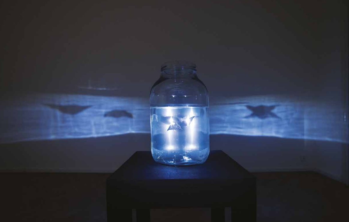
Kateryna Pokora: Skutočné more, 2024 – 2026, inštalácia, detail