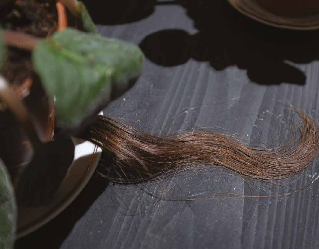
Khrystyna Silivon: Fialky, 2022 – 2026, inštalácia, kvety v črepníkoch, pramene autorkiných vlasov, detail a celkový pohľad