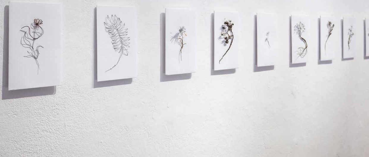
Iryna Priakhina: Ocel' v stepi. Živý archív, 2025, herbár vyrobený z ocelového drôtu, celok a detail inštalácie