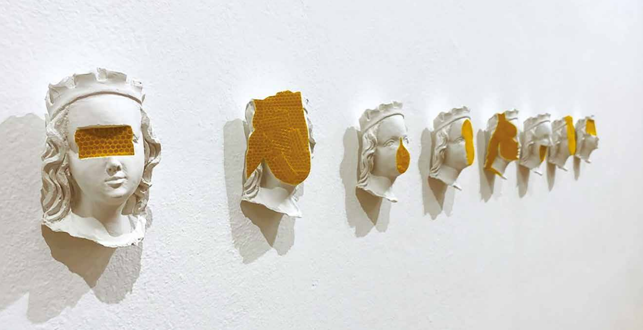
Ingrid Hoffstädter Višňovská: Slepota, 2017/2024, sadra, reflexná fólia (séria, 8 ks), celok a detail.