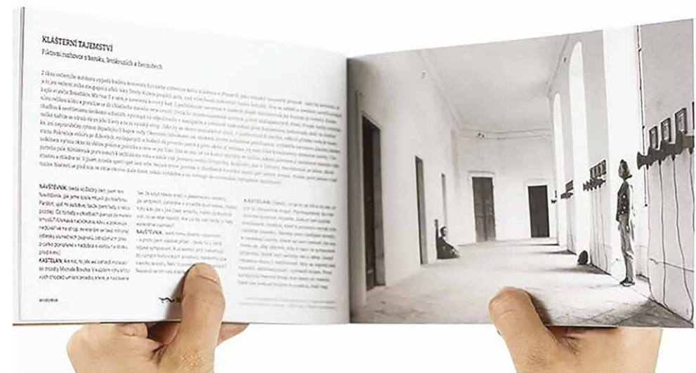
Katalóg výstavy Flashback: Hermit 1992 – 1999. Múzeum umenia, Olomouc, 2023