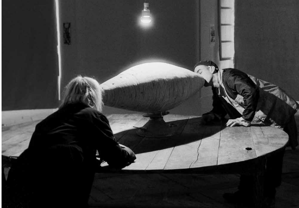
Peter van der Ent: Kircherova trúba, 1993, site-specific inštalácia, drevo, plech. Realizované v rámci sympózia Letokruhy, Kláštor Plasy, 1993.