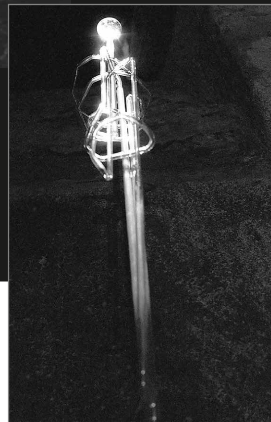
Ladislav Čarný: Destilácia svetla, 1994, systém destilačných skúmaviek a laboratórnych sklenených baniek, site-specific inštalácia, pivnica barokovej sýpky. Realizované v rámci sympózia – Fungus: prieskum miesta, Kláštor Plasy, 1994.