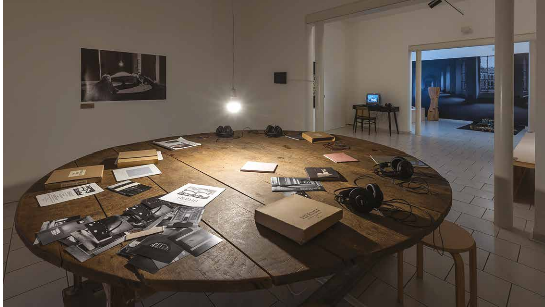
Pohľad do výstavných priestorov.