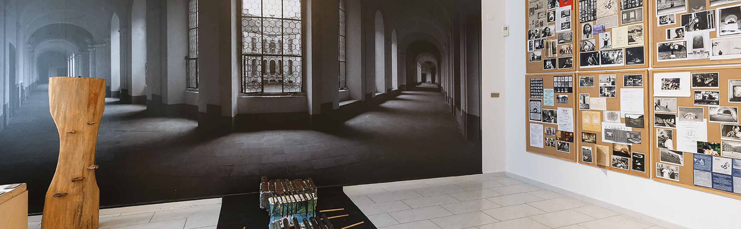
Pohľad do výstavnych priestorov.