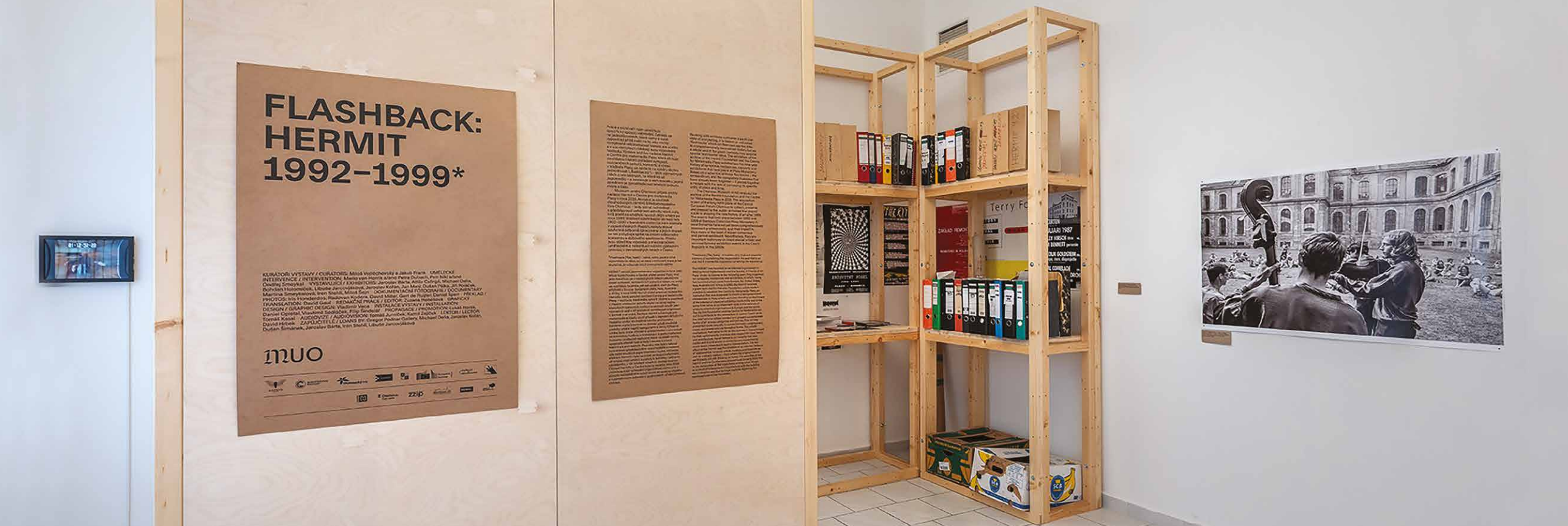
Pohľad na vstupných priestoroch výstavy.

Jak návštěvník výstavy snadno zjistil, symposia Nadace Hermit pořádaná téměř od samého začátku pod hlavičkou Centra pro Metamedia Plasy si již během své éry – a ještě spíše po jejím skončení – vydobyla bez nadsázky kulturní status. Plasy jako by tehdy byly jedním z neuralgických bodů „nové Evropy“, Evropy po pádu železné opony.