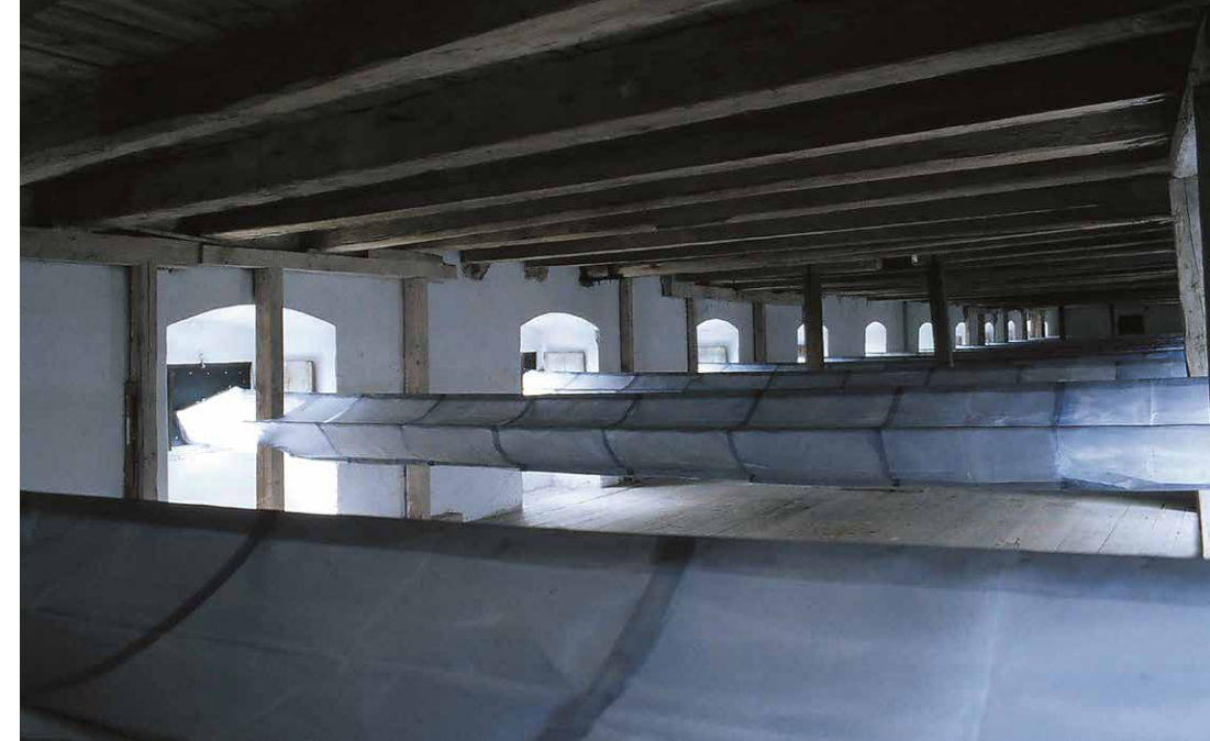
Anton Čierny: Správny dych, 1998, site-specific inštalácia, farebný papier, oceľový drôt, zrkadlá, 35 x 8 m, baroková sýpka. Realizované v rámci sympózia Ľadová slávnosť, Kláštor Plasy, 1998.