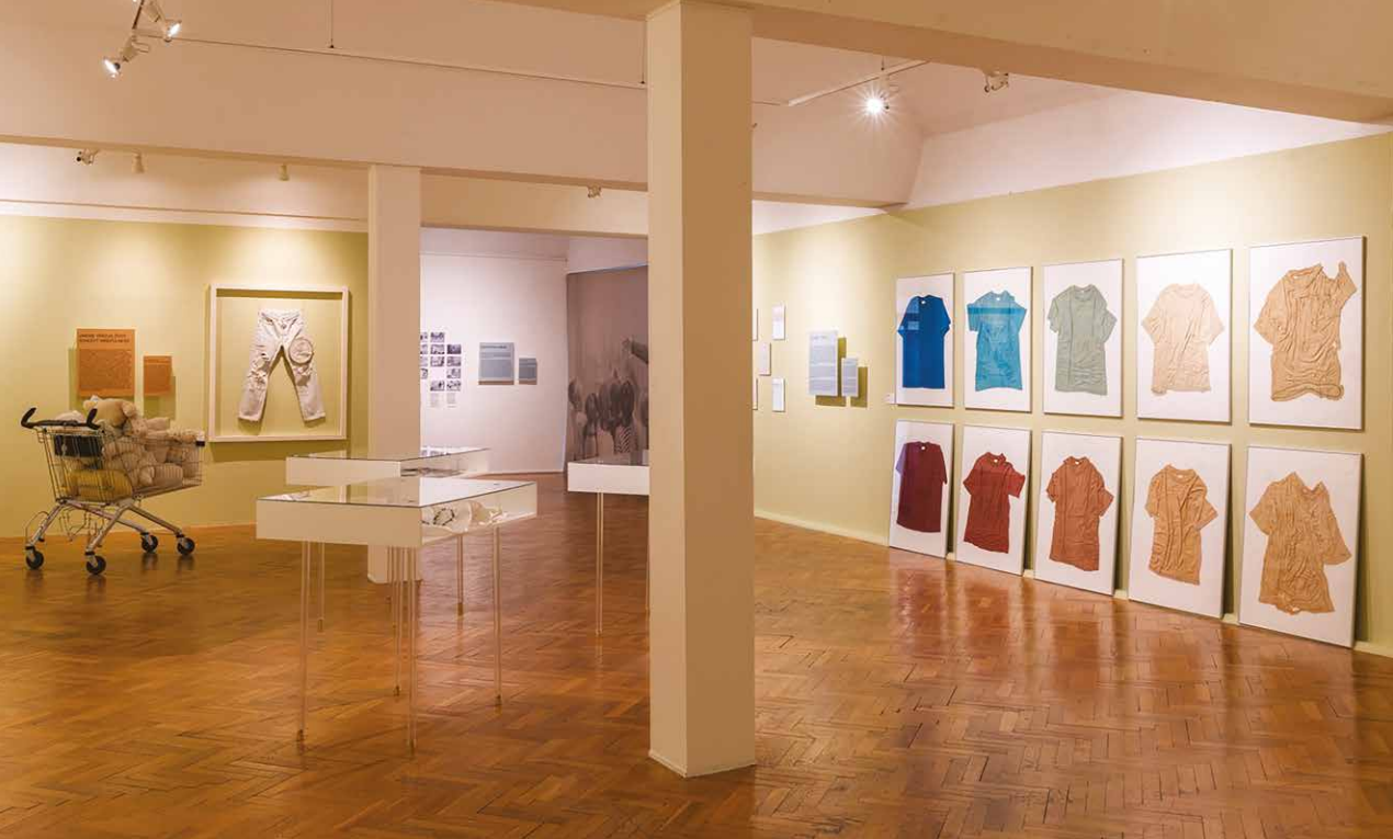
Pohľad do výstavy Ľ. S.(de)materializovaná, GMB, Pálffyho palác, 2023.