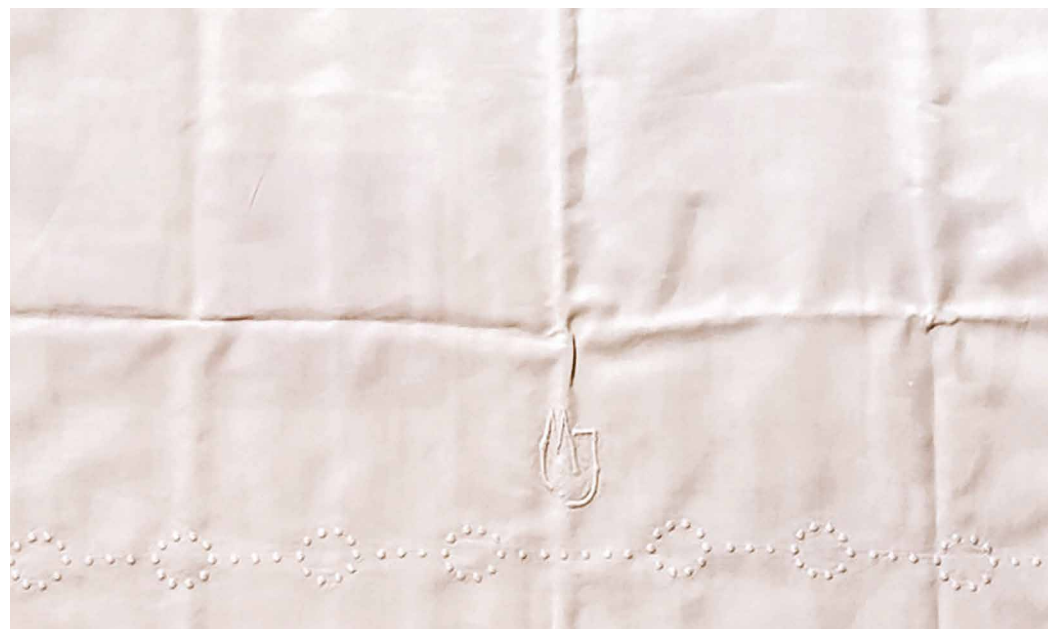
Luba Sajkalová: Monogram MJ, 2008, prestieranie z rodinnej pozostalosti a prestieranie s identickým monogramom nájdené v second-hande. Súkromný majetok. celok a detail