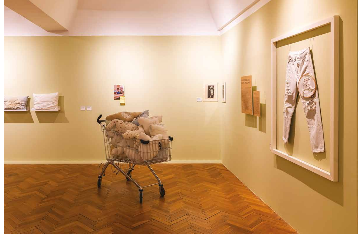
Pohľad do výstavy Ľ. S. (de)materializovaná, GMB, Pálffyho palác, 2023.

vlasmi, chlpmi a nechtami rozpustenými v čistiacom prostriedku. Na stránke SOGY je možné pod názvom Komodita Ľuba Sajkalová nájsť druhé dielo vytvorené na rovnakom princípe, ktoré autorka údajne vytvorila priamo pre aukciu. Spojenie vlastného mena so slovom komodita napovedá, že reflektovala i otázku komodifikácie umelca, ktorý sa nielen metaforicky, ale aj doslovne „stáva“ predávaným dielom. Táto hravá a ironická vrstva je len jednou časťou zneprítomneného tela, ktoré časom nabera dokonca opačné významy. Ak autorka pôvodne pracovala s dematerializáciou vlastného telesného materiálu a s jeho miznutím, teraz, keď je už neprítomná, možno s ním spájať schopnosť preparácie a uchovania aspoň časti jej fyzickej podstaty.