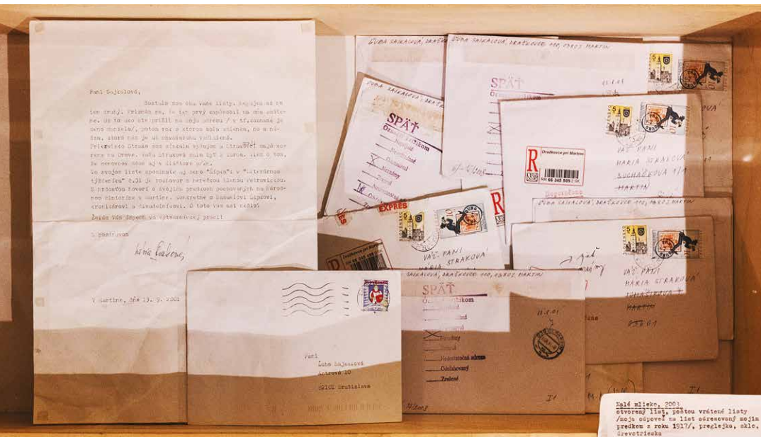
Luba Sajkalová: Malé mlieko, 2001, inštalácia, mail art. V zbierke Turčianskej galérie v Martine.