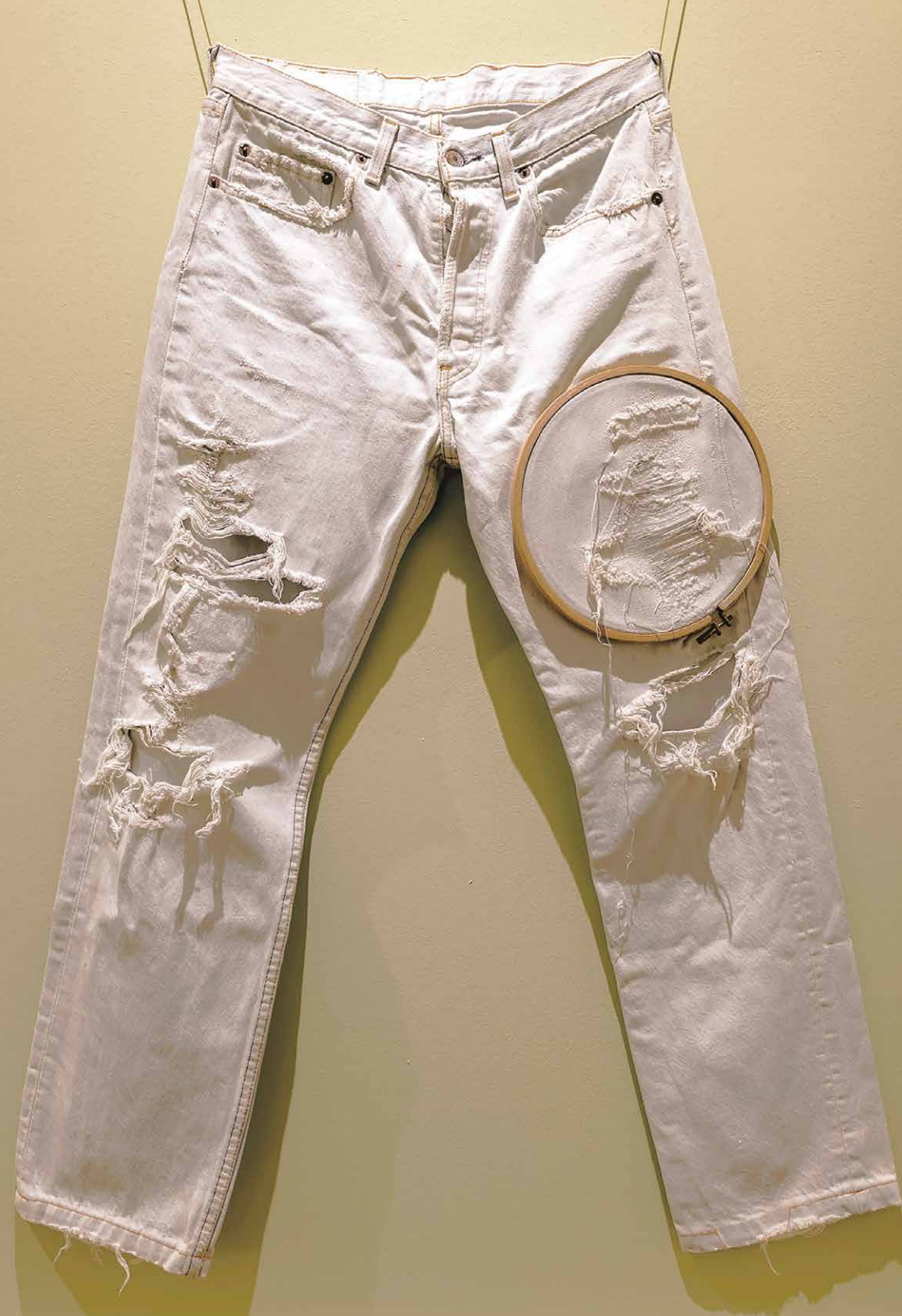
Luba Sajkalová: Pánske rifľové nohavice, 2006, rready-made, „reštaurovaný“ štopkacou technikou. Súkromný majetok.