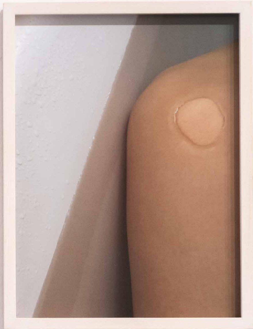
Lucia Sceranková: Jediný stav s definitívnym objemom, ale neurčitým tvarom, 2022, séria dvoch c-printov na archívnom papieri.