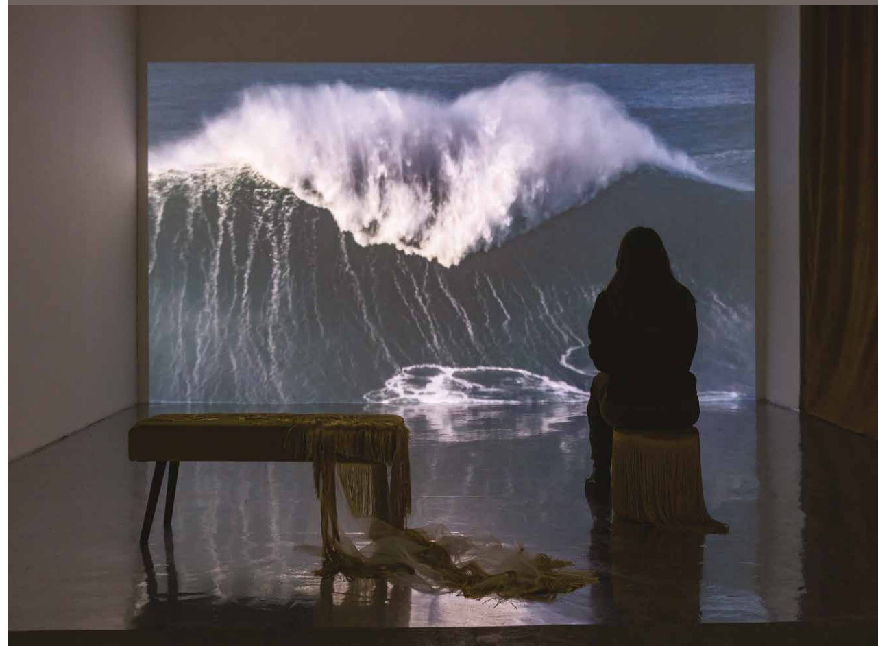
Pohľad do inštalácie výstavy Heart Seas, projekcia filmu Vlny v galérii Fotograf v Prahe, 2022.