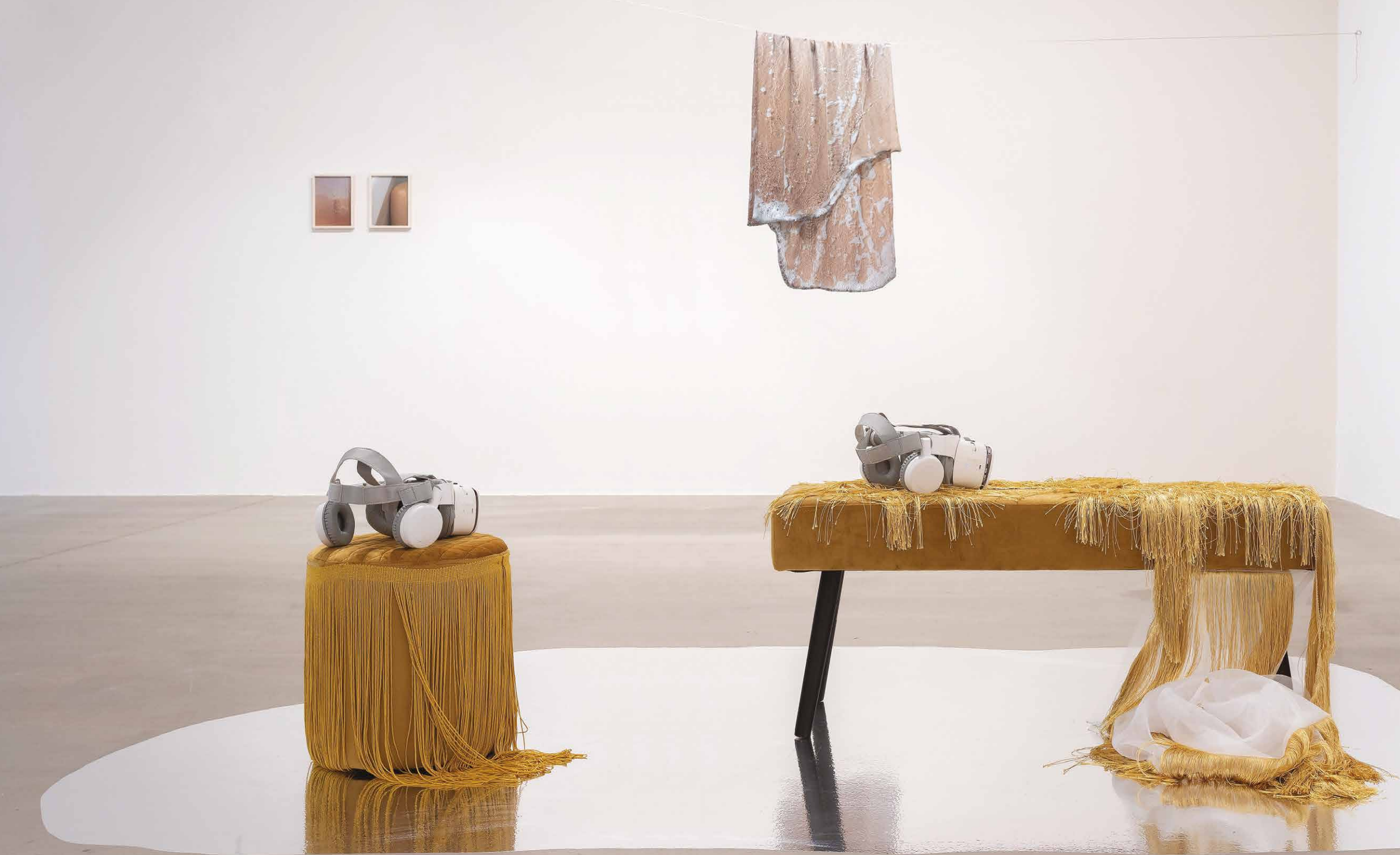
Pohľad do výstavy Heart Seas v galérii Zahorian & Van Espen v Bratislave, 2023, autorka sedenia: Zuzana Sceranková.