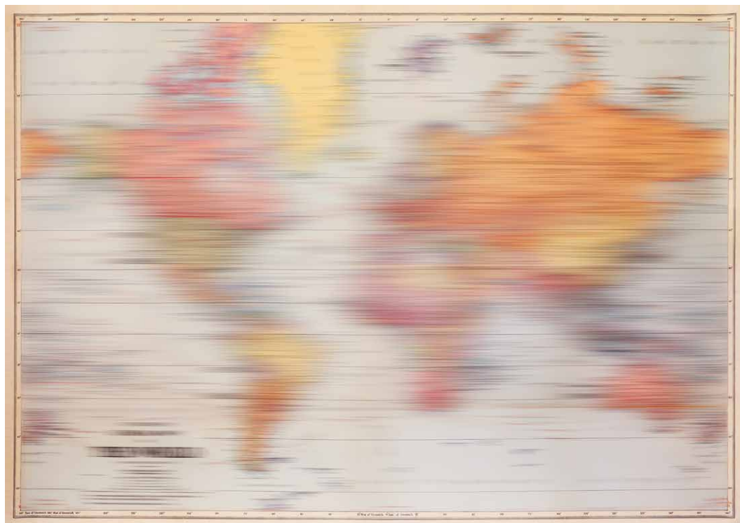
Lucia Sceranková: Mapa, 2017, pigmentová tlač na archívnom papieri