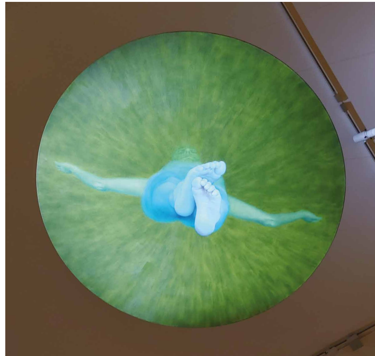
Dorota Sadvská: Modrozelený Kristus, 2021, olej na plátne, priemer 195 cm. V súkromnom vlastníctve. Inštalácia na strop vstupnej miestnosti.