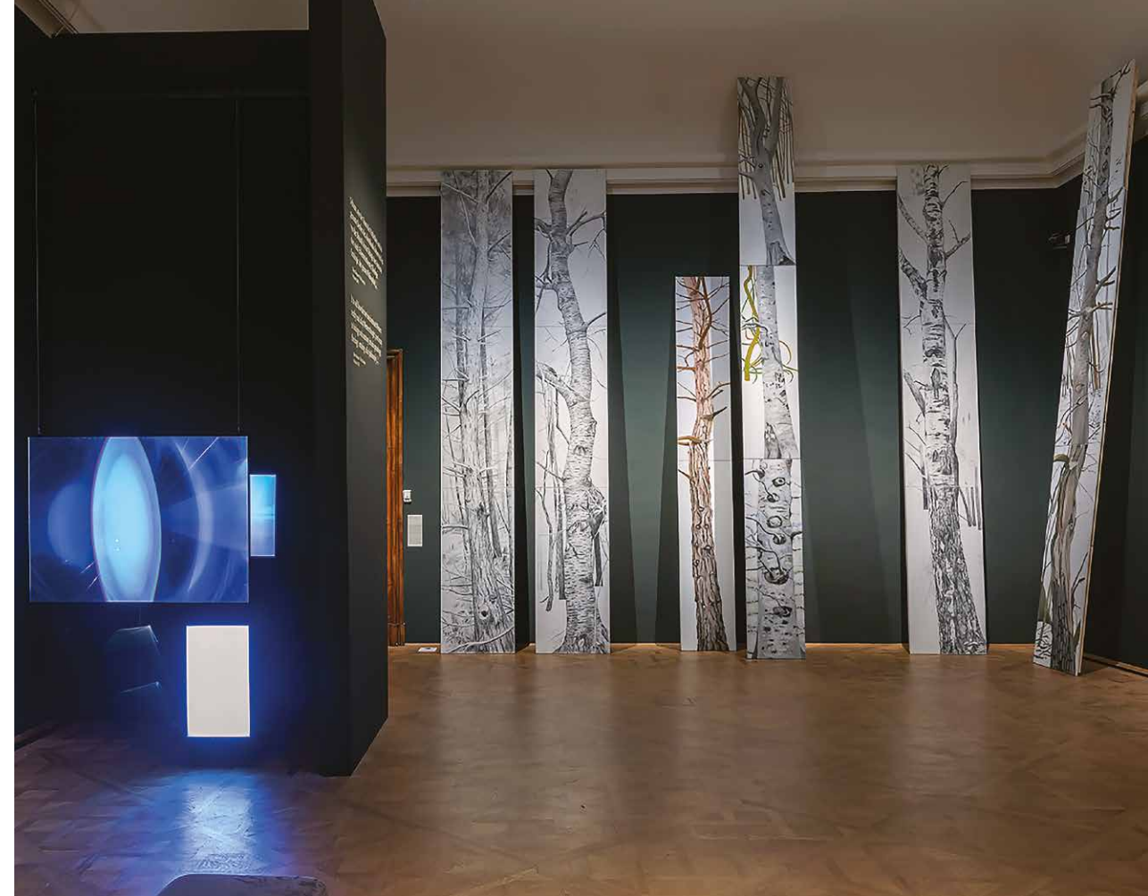
Pohľad do časti výstavy. Na čelnej stene Alois Mosbacher: Les, 2011 – 2020, inštalácia, malba na plátne. V súkromnom vlastníctve. Na ľavej strane Ralo Mayer: And turns and turns and I turn pages. (...), 2009/12, dvojkanálová videoinštalácia, zvuk, šošovka, 106,5 x 141,5 x 3,5 cm, 40 min. V zbierke Belvedere, Wien

do výstavy integruje pôvodný ikonografický program interiérov Dolného Belvedéru a ako pracuje s pohľadmi do priľahlých záhrad s výsadbou.