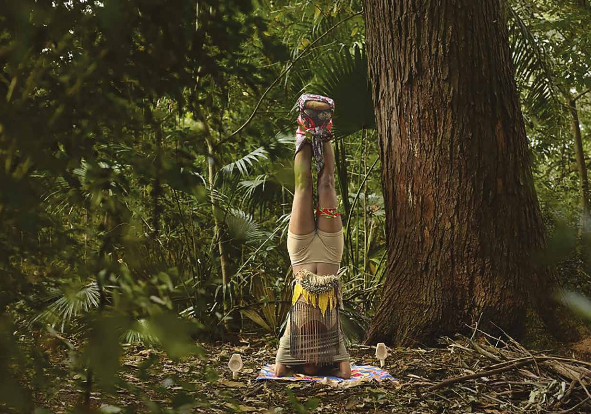
Nibar Güreş: Totem stojaci na hlave, 2014, C-print, 100 x 150 cm. V zbierke Belvedere, Wien