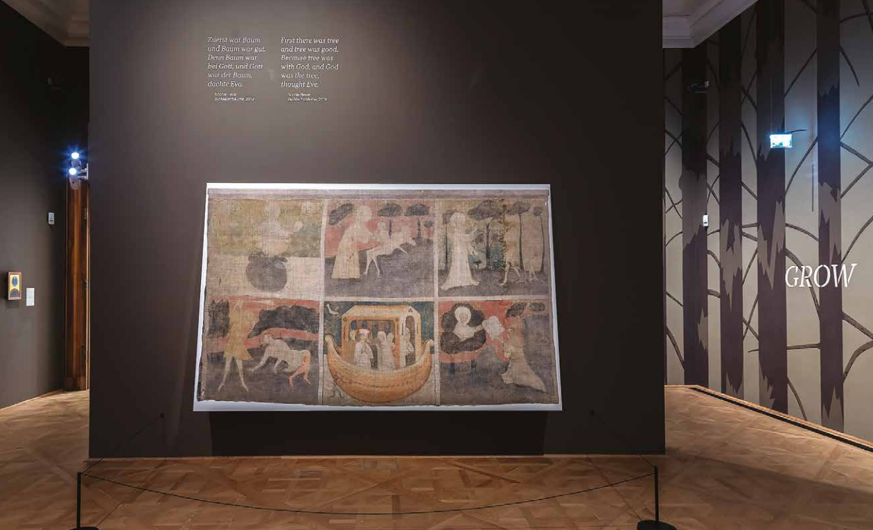
Pohľad do vstupnej časti výstavy GROW. Der Baum in der Kunst. V popredí Pöstne plátno s výjavmi zo Starého zákona, okolo roku 1400, malba na plátne, 190 x 304 cm. V zbierke Belvedere, Wien