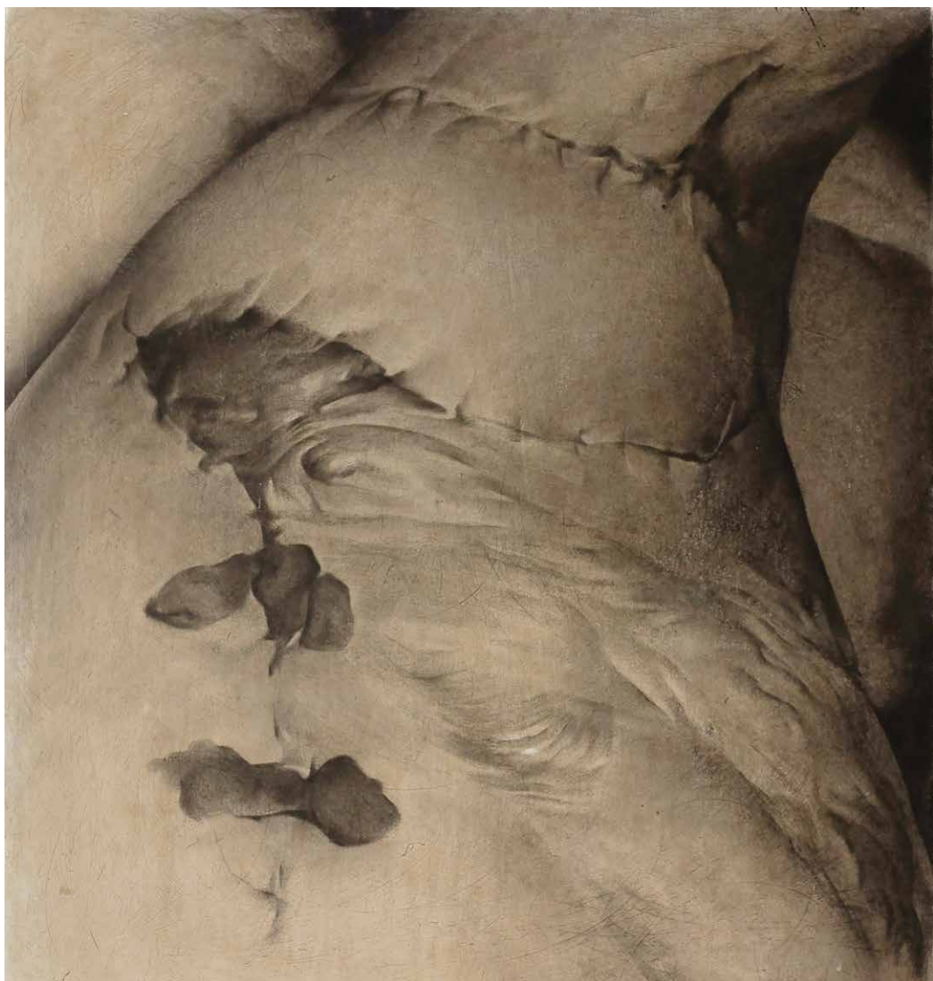
Krystyna Melnyk: zo série Rany, 2021, krieda, živica, olej, drevo, 31 x 27,5 cm