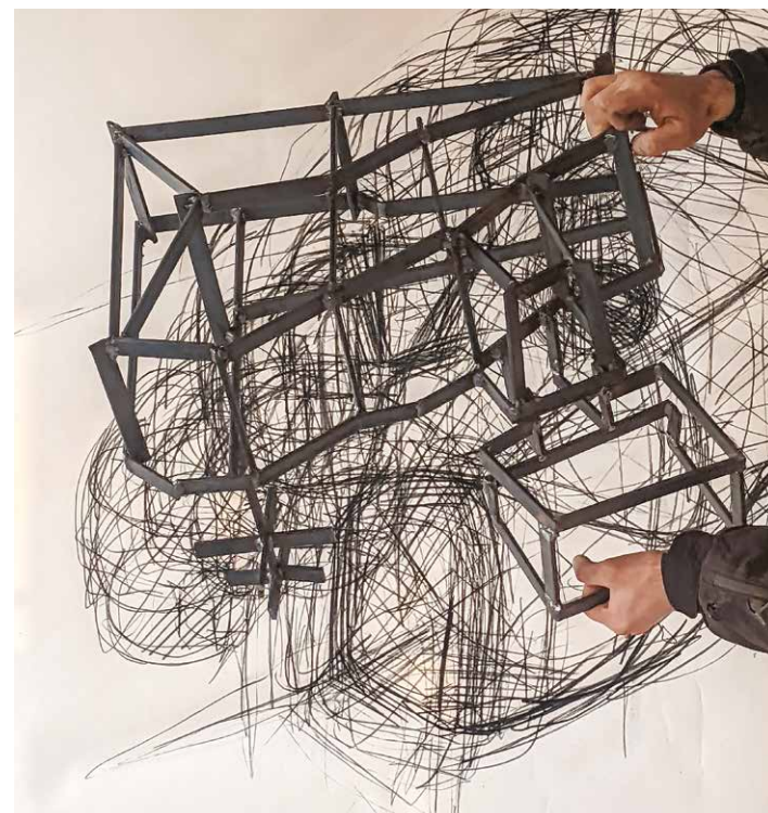
Príprava výstavy Formy krajiny pre galériu Statua

Ale najradšej robí veľké projekty, v ľudskej mierke. Celú svoju pivnicu pod domom preniesol do siete z pásoviny či odliat deväť metrov vlastnej studne. Vďaka životu na vidieku má priestor aj na tvorbu takýchto väčších diel. Neznamená to však, že by zostával celý čas na Honte. V podstate neustále cestuje, či už za dlhodobými projektami, akým je spolupráca s Periférnymi centrami v Dúbravici, alebo každoročné Sečovské bienále umenia , často realizuje aj diela s ďalšími umelcami. Hont je tým bodom, do ktorého sa už roky vo väčších či menších špirálach vracia, a v ktorom našiel väčšinu inšpirácie pre svoju tvorbu.