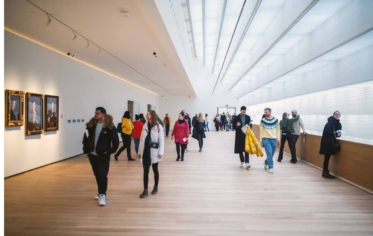
Návštevníci v priestoroch zrekonštruovaného premostenia.