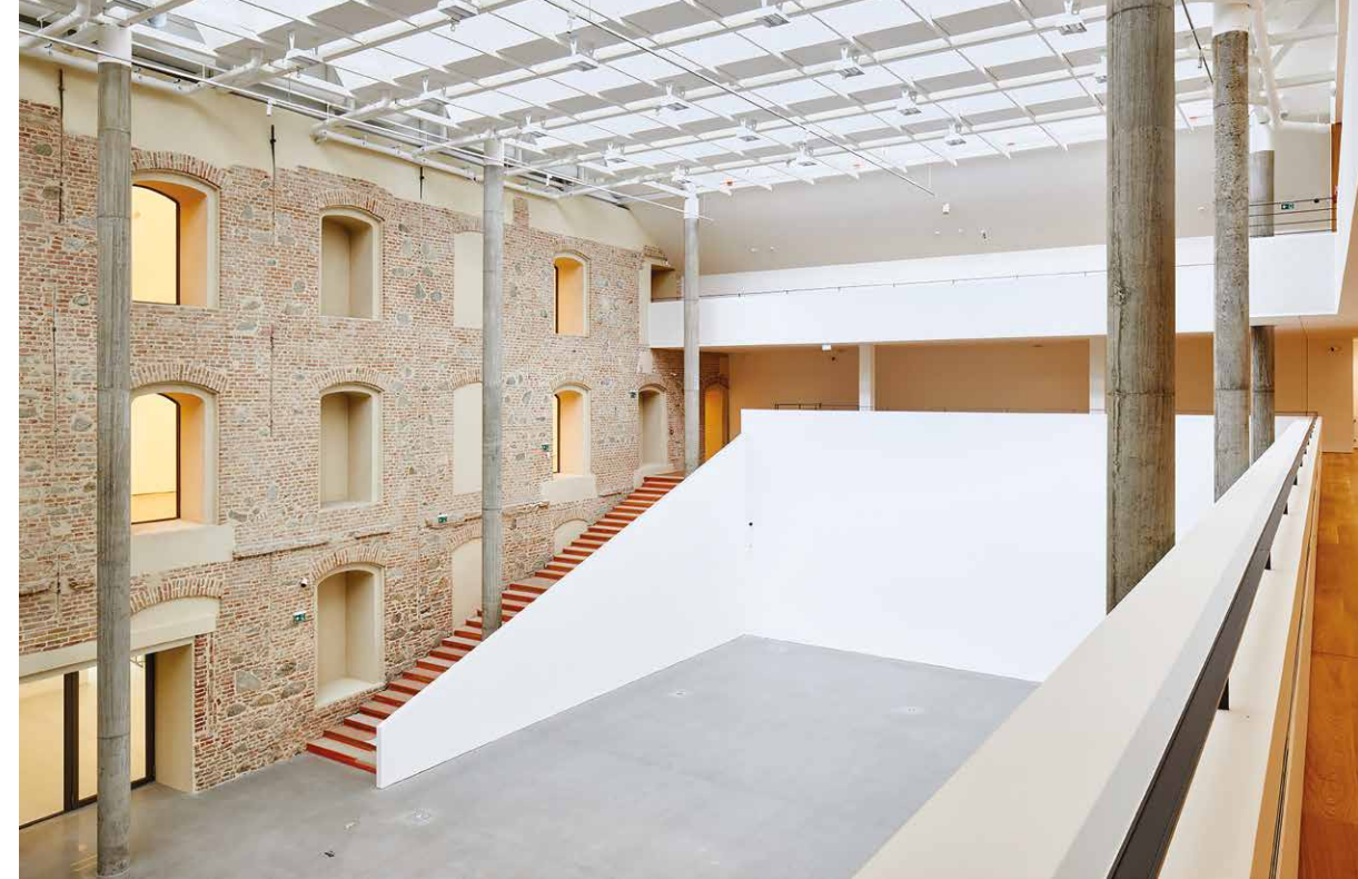
Bývalý amfiteáter sa prestrešením zmenil na veľkú výstavnú a eventovú sálu.

“In a situation where even spectacular exhibitions in department stores compete with galleries, an art museum as a place to spend leisure time is a necessary and welcome alternative. Of course, it is necessary to maintain the standard.”