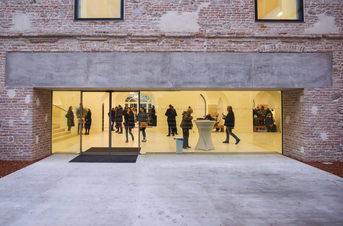
Pohľad na vstupné priestory zrekonštruovanej SNG.