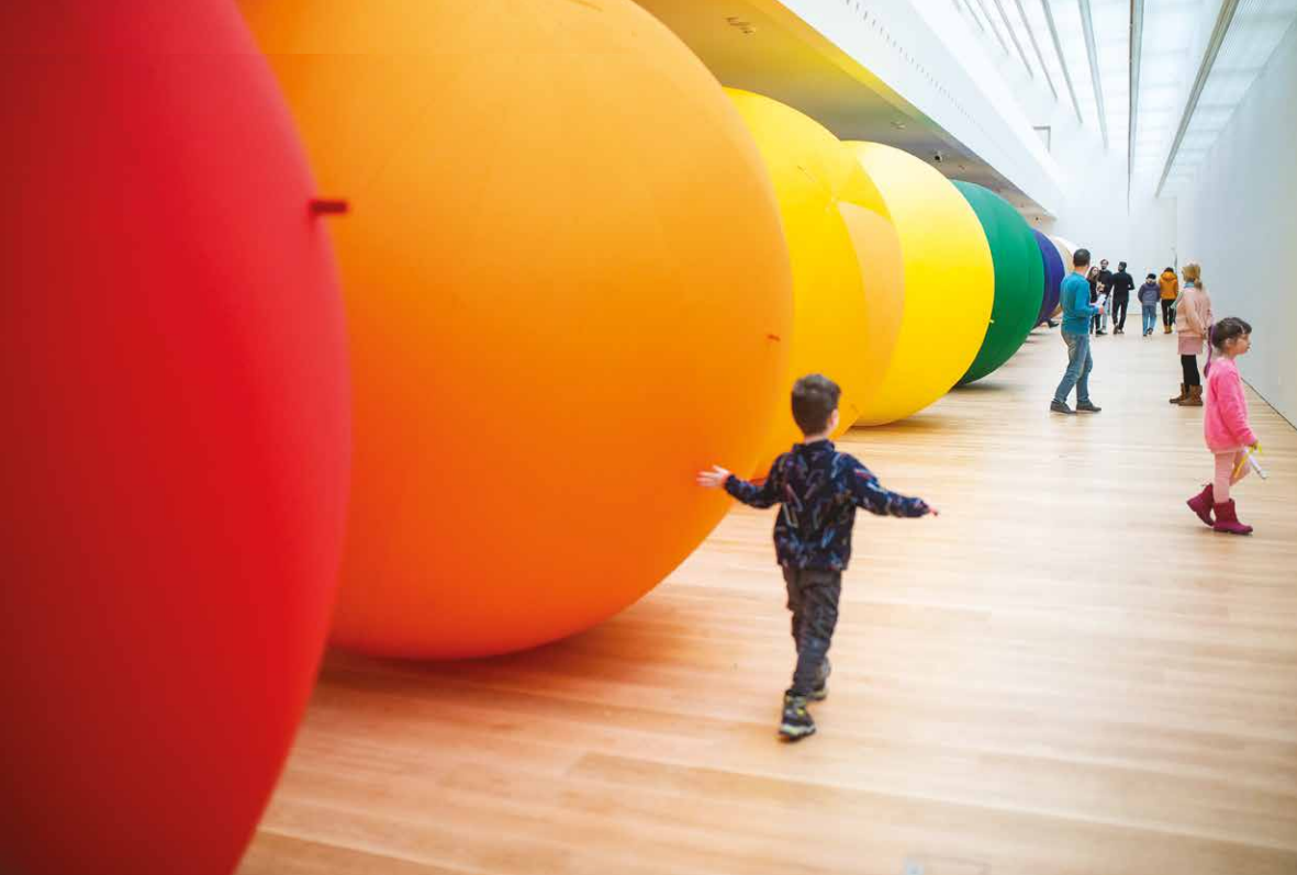
Detskí návštevníci v priestore premostenia medzi balónmi Stana Filka zo sekcie výstavy Prolog. 12 farieb reality.