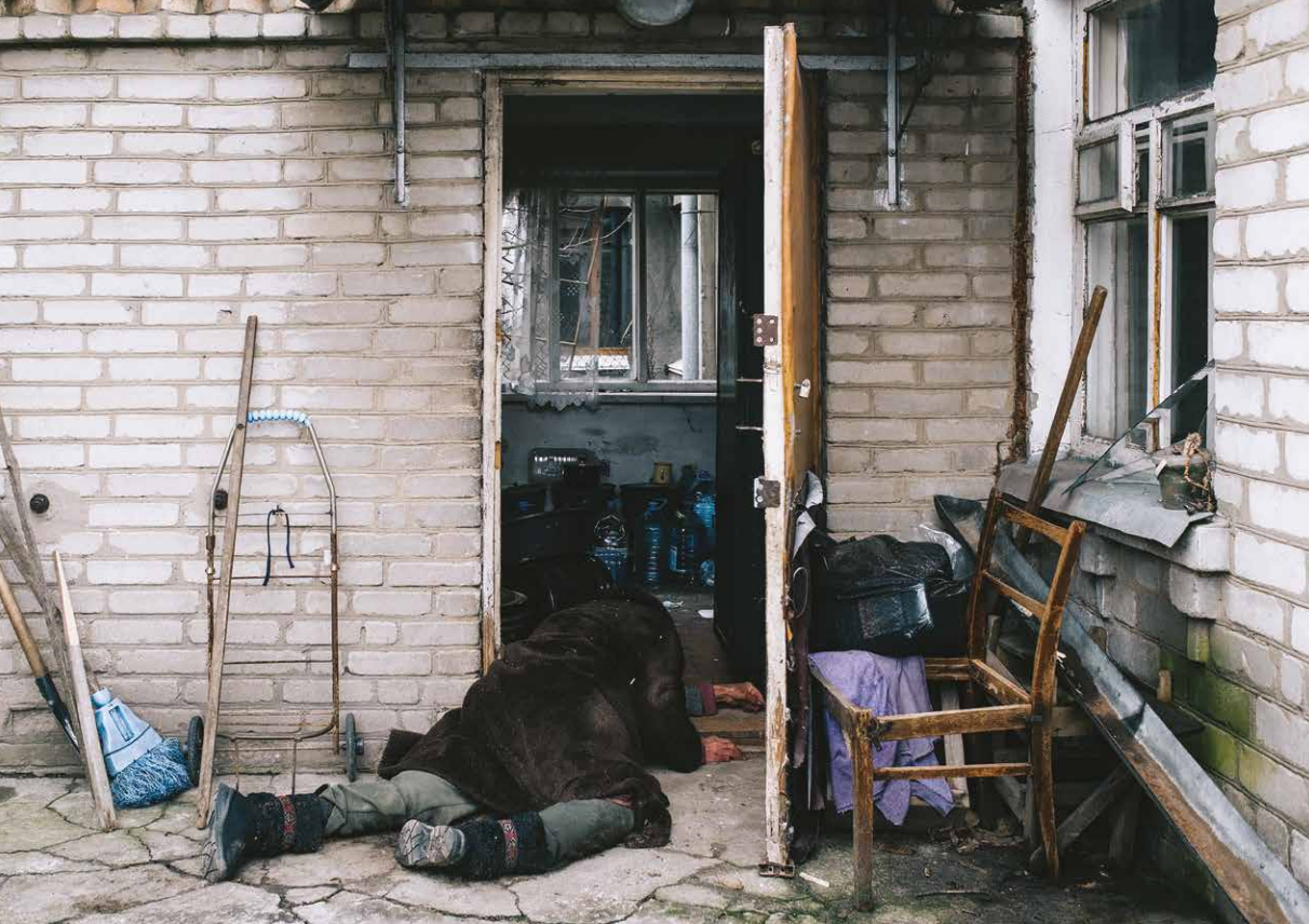
Mesto Buča, región Kyjev, 6. apríl 2022. Kvôli mínometnému ostrelovaniu zomreli dve staršie ženy, jedna na prahu domu, druhá v kuchyni svojho bytu.

vzťahy. Z dnešného pohľadu sa však javí, že zo strany Ruska išlo len o krycí manéver Putinovej ranej vlády. Aj na jeho vtedajšiu „protiteroristickú operáciu“ v Čečensku sa Západ pozeral aj cez optiku útoku na Svetové obchodné centrum. Myslím, že sme vtedy Rusko vnímali naivne optimisticky. Osobne sa totiž domnievam, že imperialistické a dobytvačné ambície sú v Rusku historicky zdedené minimálne od počiatku novoveku, keď sa zaviedol pojem „ruské impérium“. Je v podstate jedno, či toto impérium budovali cári alebo neskôr komunistickí diktátori – prostriedky boli vždy rovnako násilnícke. Nedostatok slobodného myslenia a ekonomická zaostalosť Rusku nikdy neumožnili použiť tzv. mäkkú silu, teda „dobýjanie“ územia obchodom či príťažlivým životným štýlom, ako to robil Západ. Prechod od feudalizmu rovno ku komunizmu a absencia demokratických spoločenských štruktúr vytvorili v Rusku úplne iný druh „civilizácie“, ktorá je v prirodzenom konflikte s liberálnym svetovým poriadkom. Skúsenosť s „jelcinovskou demokraciou“ bola pomerne bolestná a doviedla Rusko opäť k obľúbenej diktátorskej vláde. Putin sa po konsolidácii moci v nultých rokoch ideologicky pripravoval na opätovné obnovenie „ruského impéria“. Na druhej strane vojenská modernizácia Ruska zjavne prebiehala v duchu „potemkinovskej“ tradície danej systémom skorumpovanej kleptokracie – ako sa zatiaľ javí z vývoja vojny na Ukrajine.