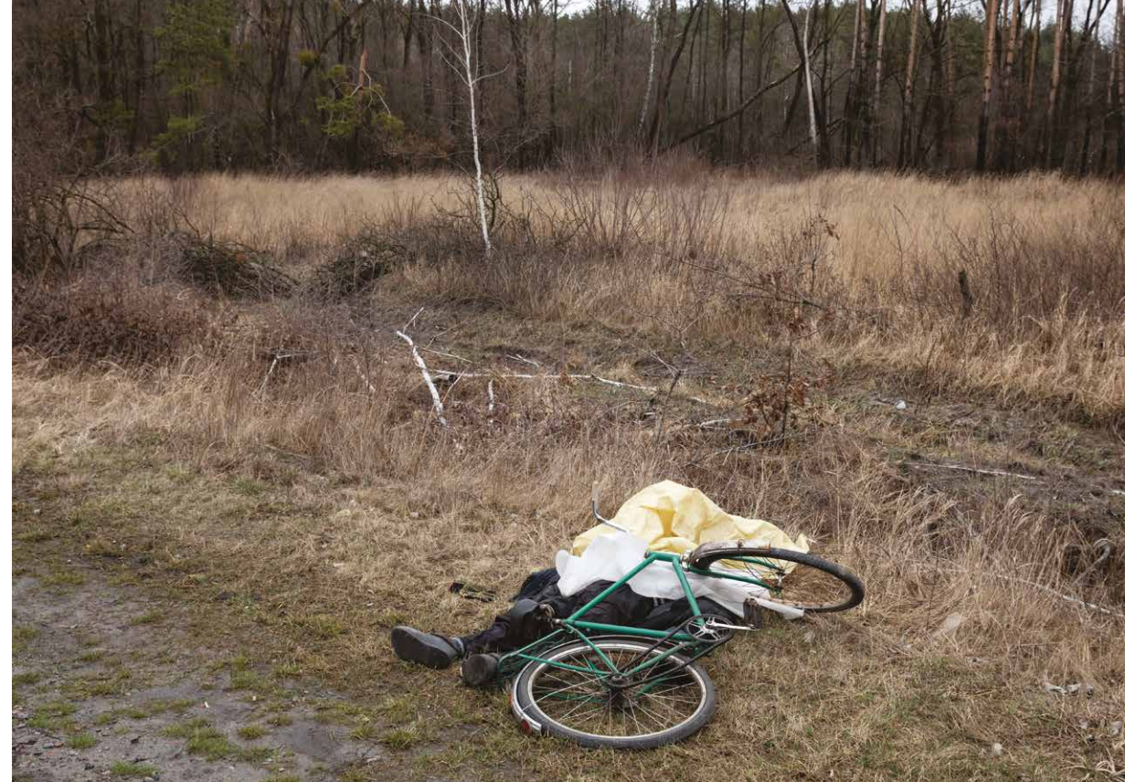
Mesto Buča, región Kyjev, 2 apríl 2022. Muž zabitý ruskými vojkami počas jazdy na bicykli.

Jana Geržová: V súvislosti s ruskou agresiou na Ukrajine členské štáty Európskej únie, USA a Spojené kráľovstvo schválili viacero protiruských sankcií, ktoré mali vplyv i na desiatky ruských oligarchov,