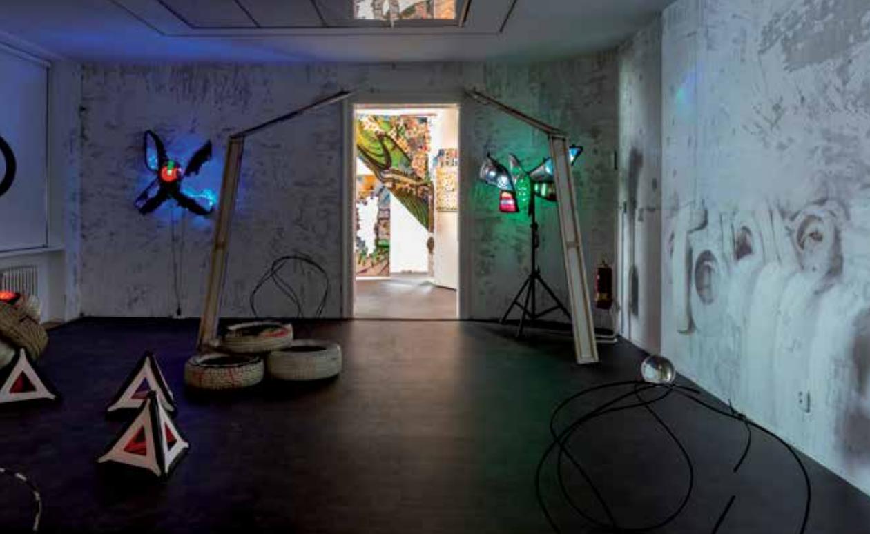
Inštalácia priestoru s názvom „pneumatrix“ s projekciou videa.