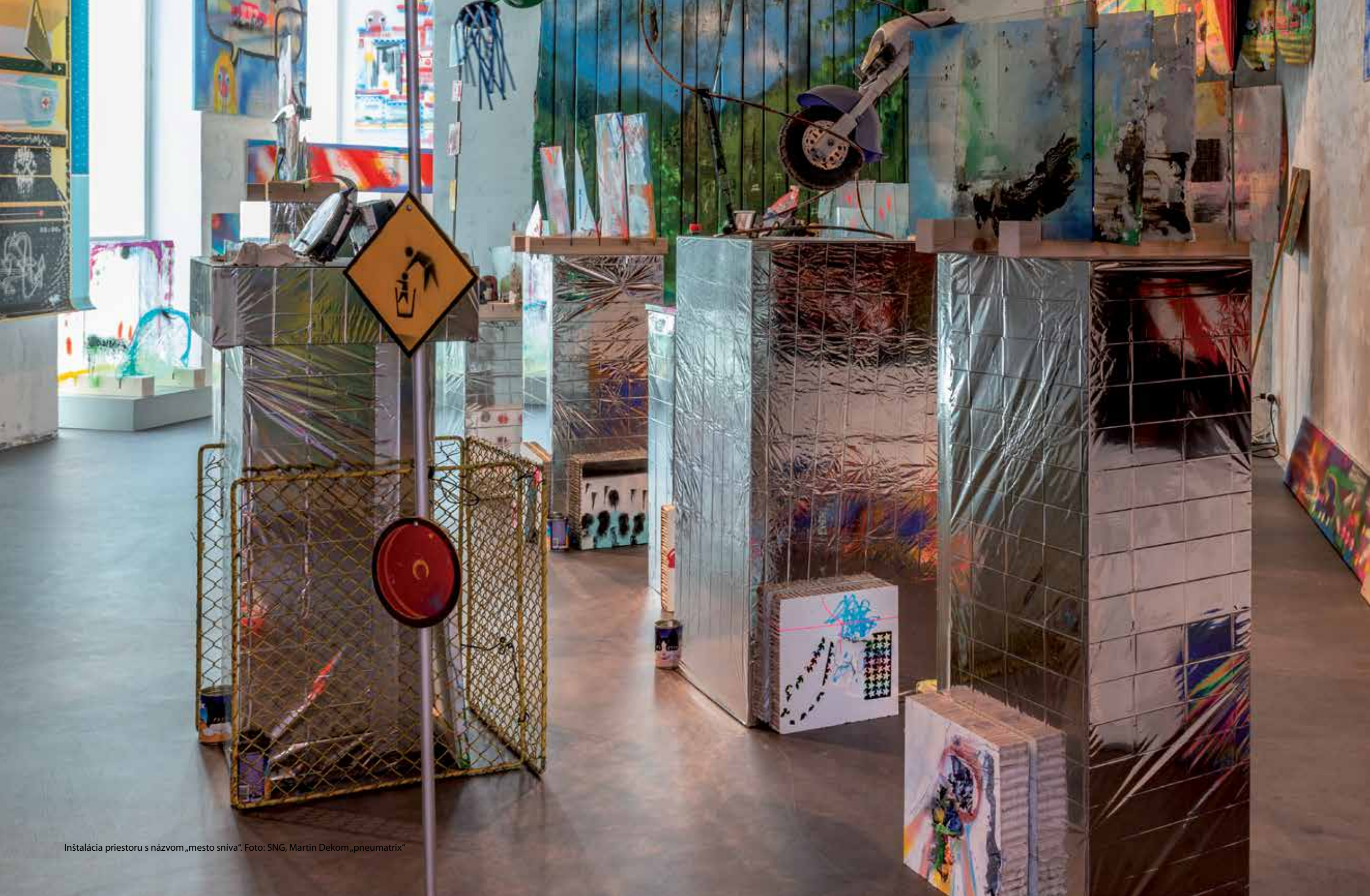
Inštalácia priestoru s názvom „mesto snívá“. „pneumatrix“