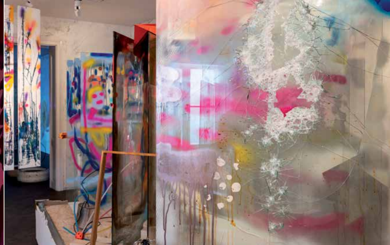
Inštalácia priestoru s názvom „H/M oteľ“.