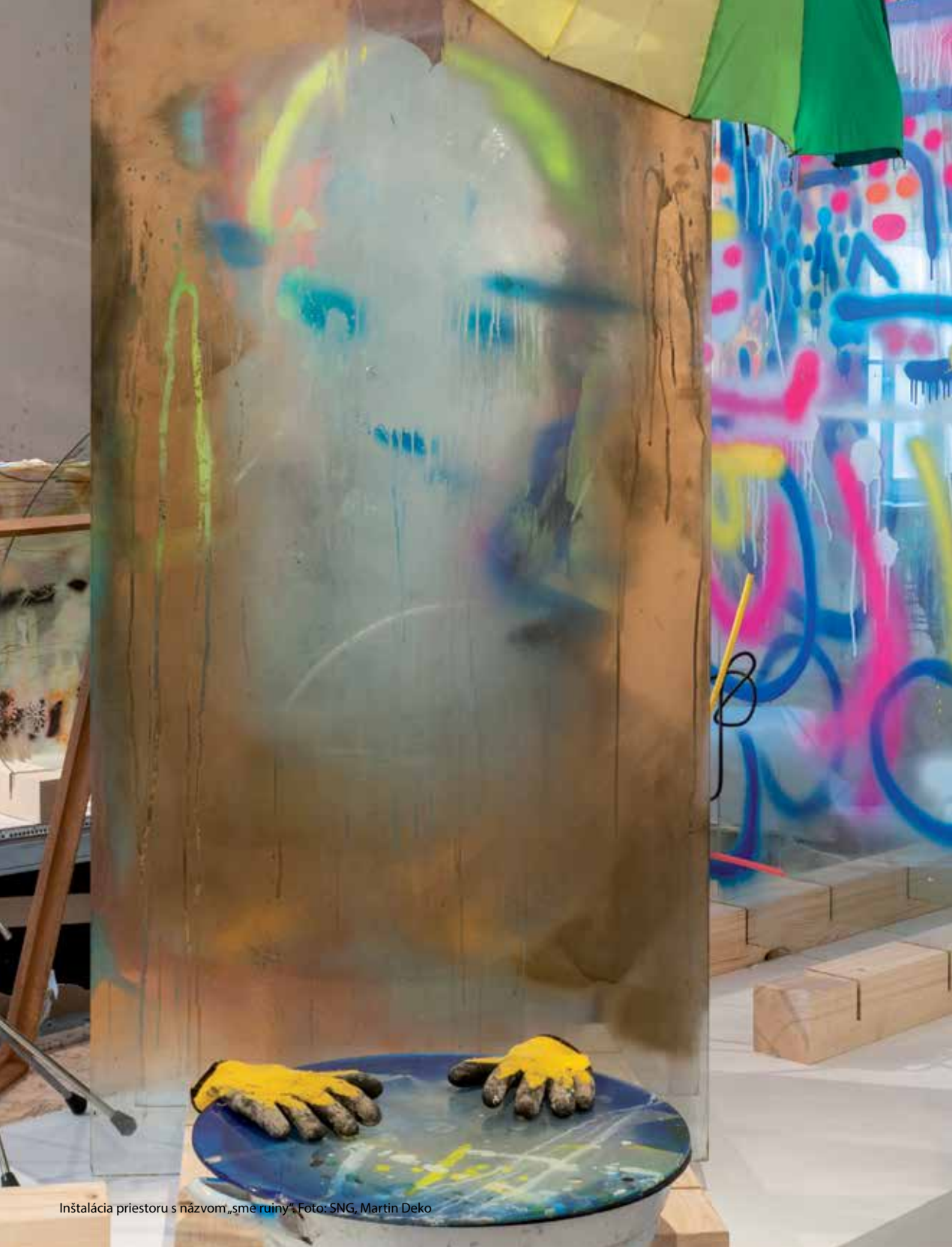
Inštalácia priestoru s názvom „sme ruiny“.