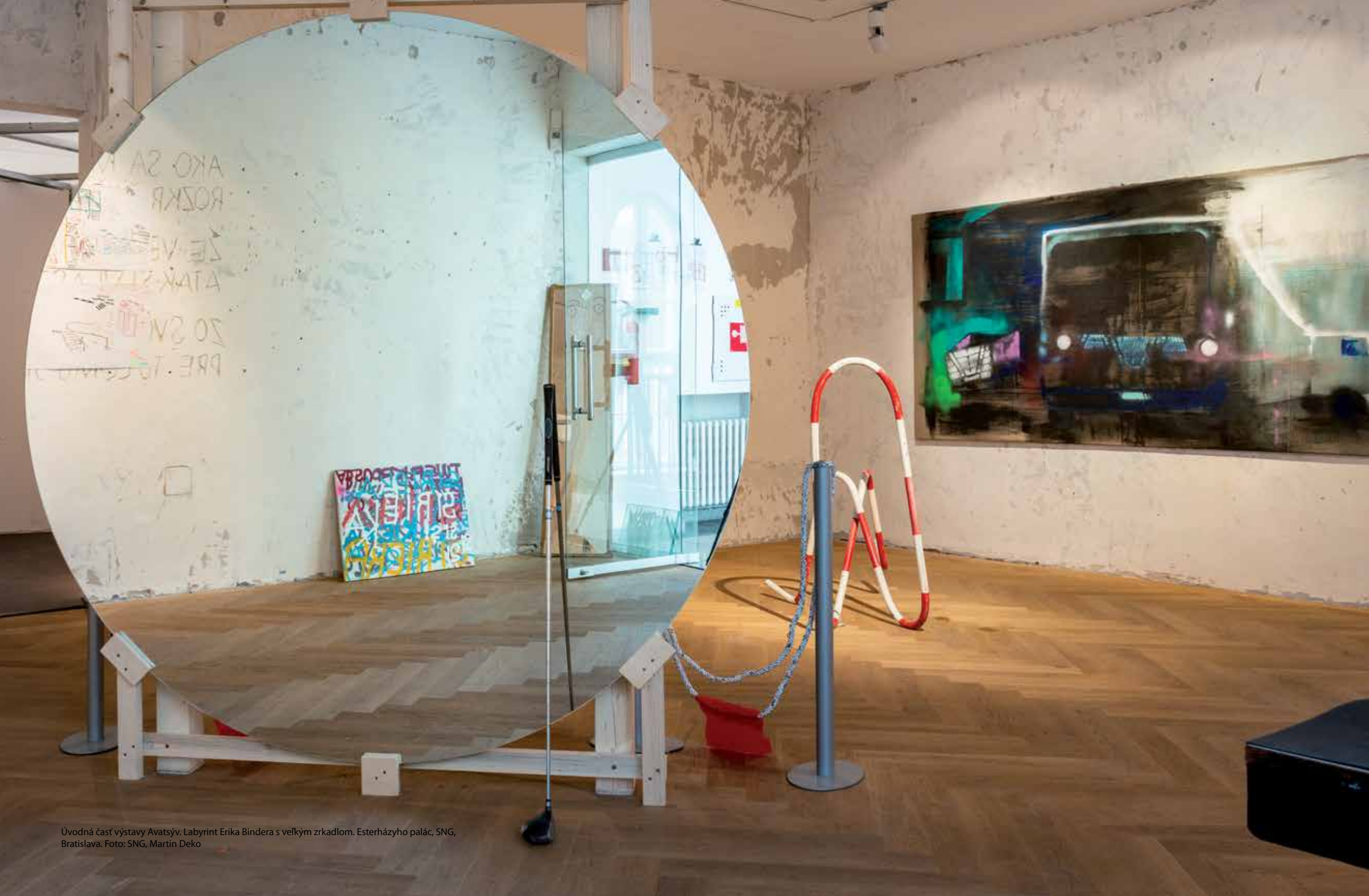
Úvodná časť výstavy Avatsýv. Labyrint Erika Bindera s veľkým zrkadlom. Esterházyho palác, SNG, Bratislava.