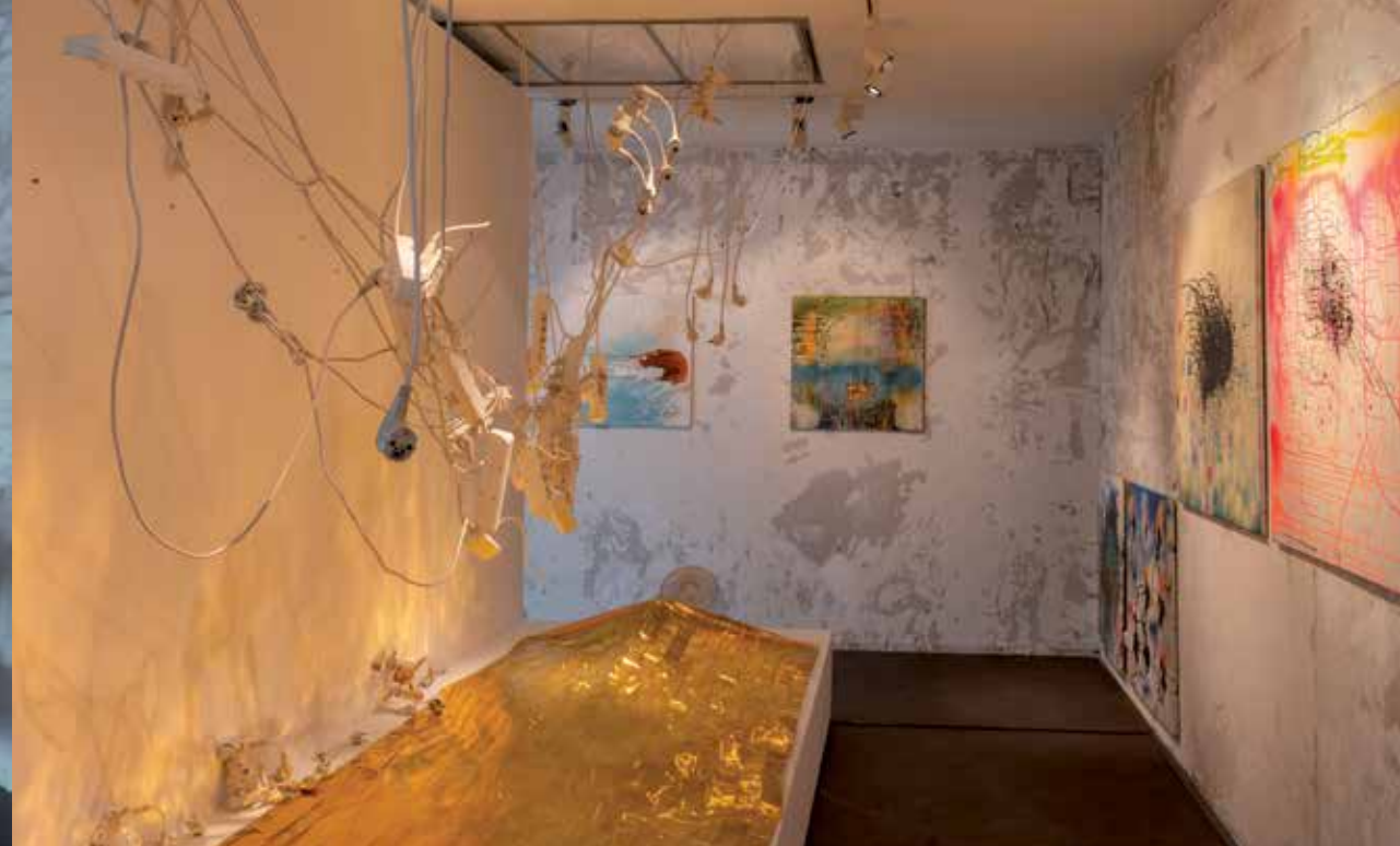
Naľavo Erik Binder: Elektroinštalácia, 2005, predlžovačka, motor, káble, elektrická zástrčka. Dielo zo zbierky SNG na výstave reaktualizované umelcom.