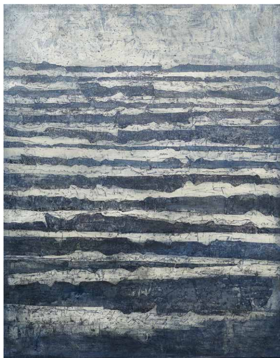
Olga Karlíková: More, 1961, olej na plátne. Galerie umění Karlovy Vary