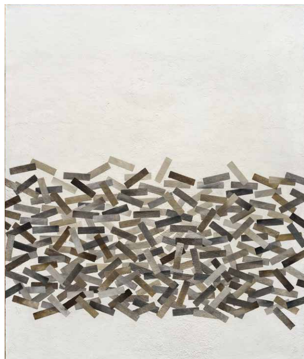
Olga Karlíková: Hemženie, 1967, olej na plátne. Sophistica Gallery, Praha