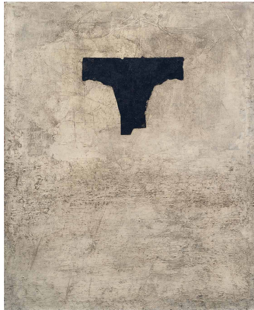
Olga Karlíková: Ikaros, 1963, olej na plátne. Súkromná zbierka