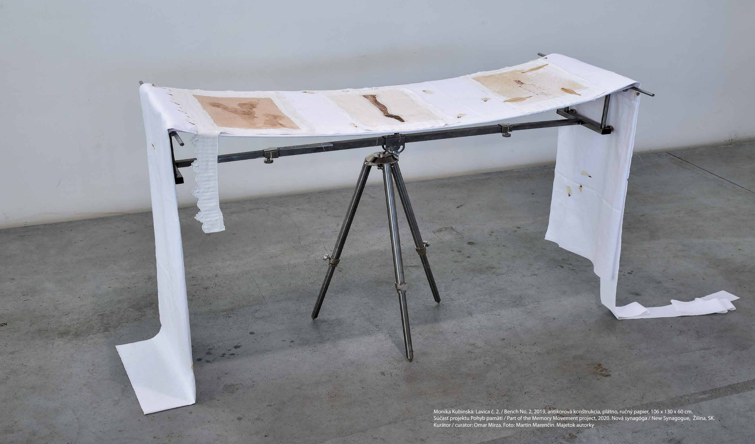
Monika Kubinská: Lavica č. 2. / Bench No. 2, 2019, antikorová konštrukcia, plátno, ručný papier, 106 x 130 x 60 cm. Súčasť projektu Pohyb pamäti / Part of the Memory Movement project, 2020. Nová synagóga / New Synagogue, Žilina, SK. Kurátor / curator: Omar Mirza. Majetok autorky