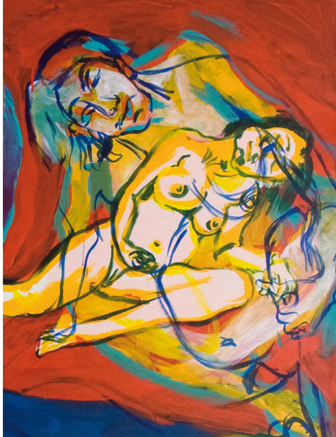
Ildikó Pálóvá: Tehotná žena, 2009, olej na plátne, 206 x 215 cm. Zbierka Nadácie Mladá maľba. Celok a detaily