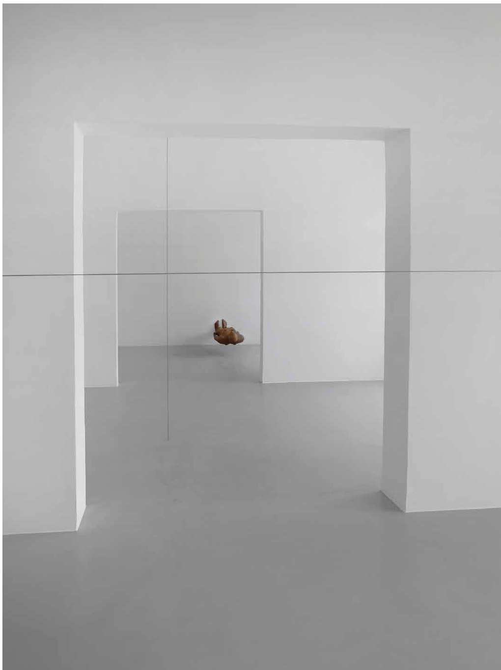
Z výstavy Antony Gormley: Prítomnosť. Dom umenia České Budějovice, 2019, kurátor Michal Škoda.