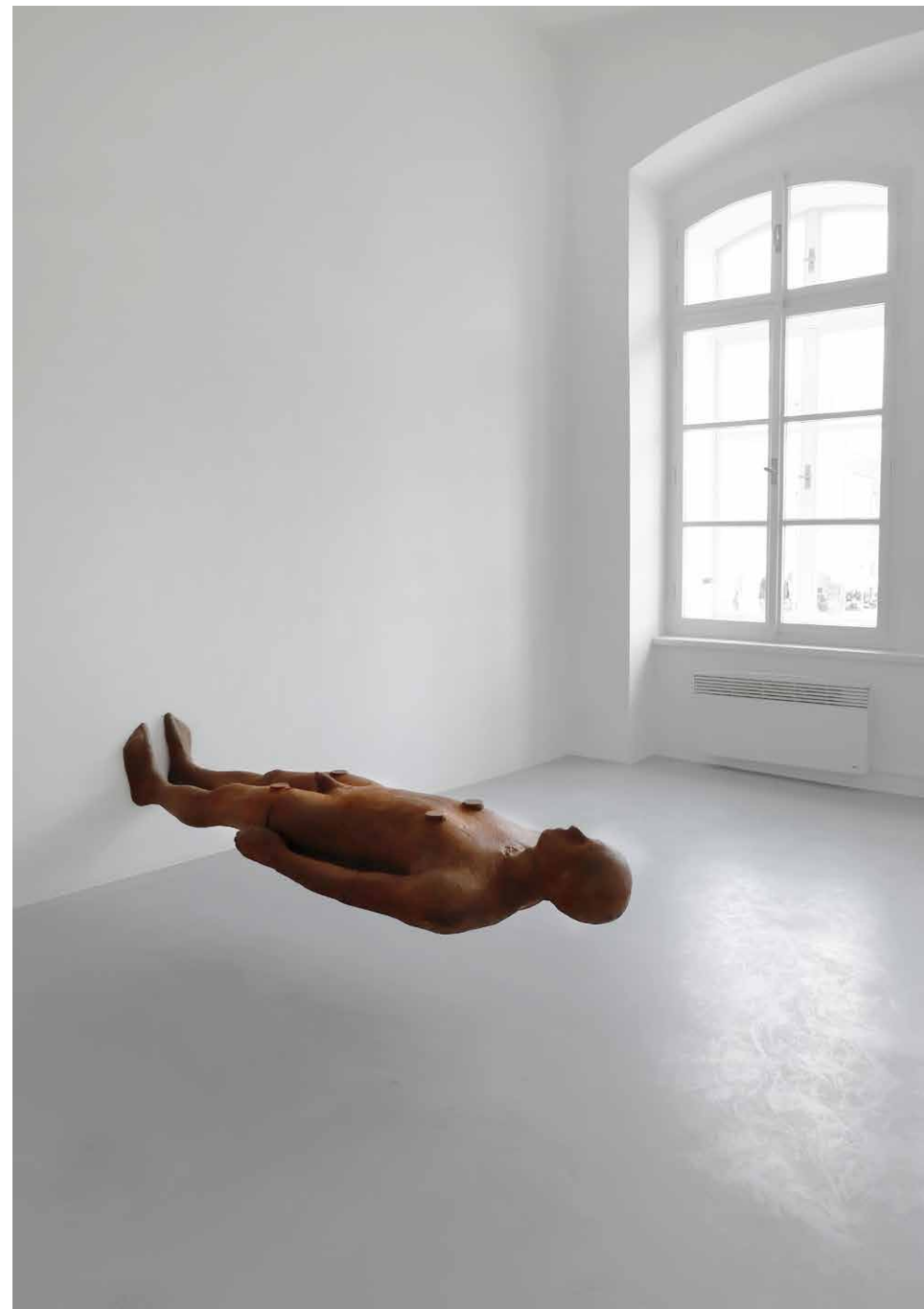
Antony Gormley: Hrana III, 2012, skulptúra, liatina, 630 kg. Z výstavy Prítomnosť. Dom umenia České Budějovice, 2019, kurátor Michal Škoda.