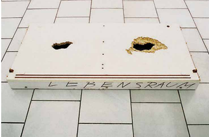
Michal Moravčík: Didaktická pomôcka, 2003, objekt. Pohľad do výstavy Internal Affairs, CC Centrum Bratislava, 2004.