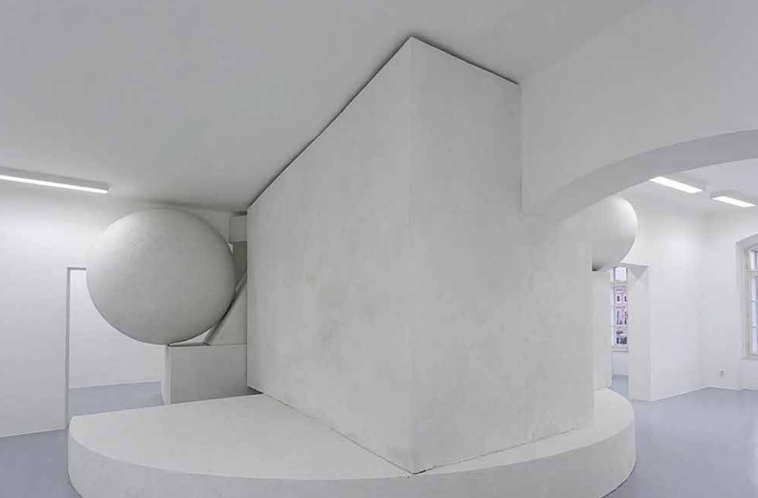
Pohľad do výstavy Dominik Lang: Procházení zdí, 2013, Dom umenia, České Budějovice.

„Výstava začala byť v modernej dobe tým médiom, cez ktoré poznávame väčšinu umenia a cez ktoré sa tvoria jeho významy.“ 3 V smere uvažovania historicky umenia Terezy Nekvindovej sa pozrime na hlavné rysy Škodovej kurátorskej práce: „Škoda svoju koncepciu založil na presnom dávkovaní vystavujúcich späť s regiónom a etablovaných osobností českého umenia. Okrem tradičných médií začal postupne vystavovať aj inštalácie, novomediálne práce, fotografiu a architektúru. Nebál sa dať príležitosť čerstvým absolventom umeleckých škôl a pomerne skoro sa začal orientovať na zahraničných umelcov, čo mu umožnilo vyviazať sa z miestneho kontextu a postaviť úzko vymedzený program bez toho, aby po čase vyčerpal všetky možnosti dané nevelkou miestnou scénou.“ 4 Výstavný program je koncipovaný ako séria prezentácií a jednotlivé výstavy ako sondy do aktuálnej tvorby jednotlivca (v prípade architektúry ateliéru). Kurátor nezostavuje tematické celky. Prihliada tiež na to, aby mali vystavujúci v Českej republike svoju premiéru a návšteva galérie sa stala lákadlom aj pre záujemcov z iných miest, prípadne aj z blízkeho Nemecka a Rakúska. Ďalšia z kľúčových otázok je otázka priestoru. Škoda systematicky upgradoval galerijný priestor Domu umenia do