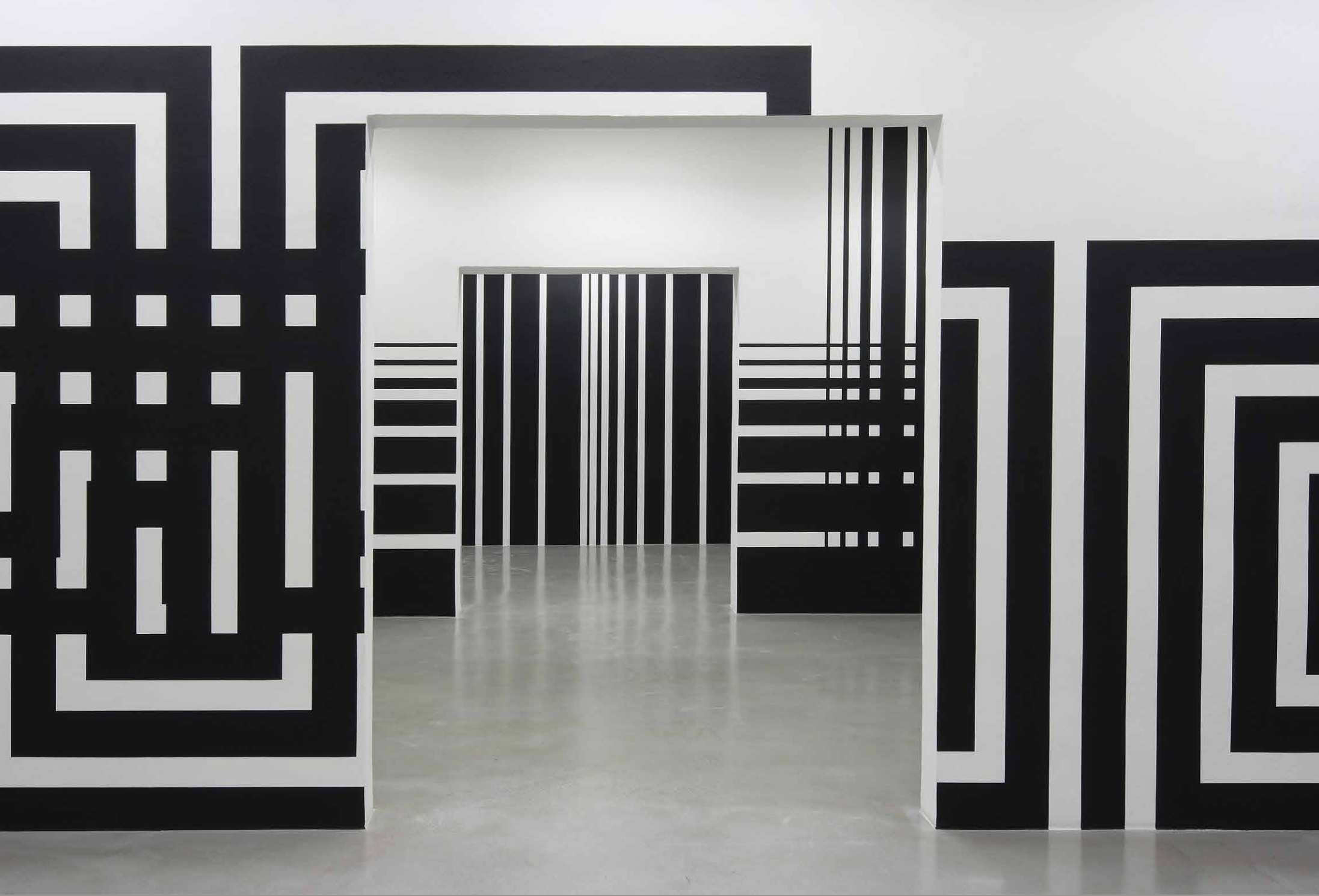
Pohľad do výstavy Liama Gillicka: Wall diagrams from the 1990s and early 2000s, 2009 – 2010, Dom umenia, České Budějovice.