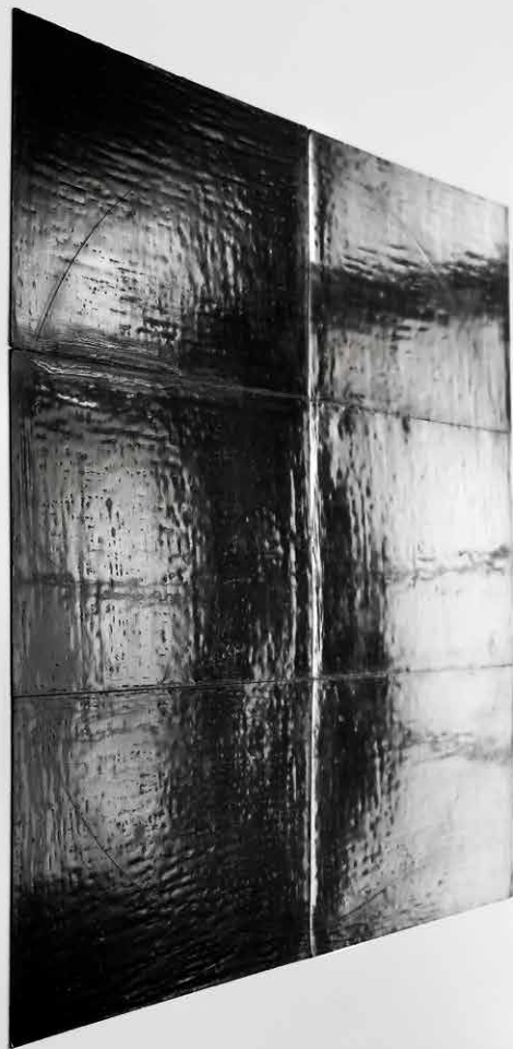
Nahum Tevet: Eight Times Six (For two Rooms) / Osem krát šesť (Pre dve miestnosti) 1977, kresba, čierny voskový pastel, detail.