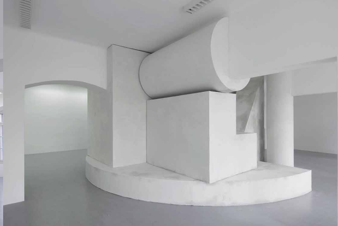
Pohľad do výstavy Dominik Lang: Procházení zdí, 2013, Dom umenia, České Budějovice.

aktuálnej podoby „white cube“, kde sú eliminované všetky rušivé momenty, aby mohol divák čo najlepšie vnímať vystavené umenie. „Dôležitý je každý detail, pretože sám galerijný priestor sa stal médiom, ktoré spoluvytvára umelecké dielo, alebo je jeho súčasťou.“ 5 To je skvelým predpokladom pre prezentáciu site-specific projektov, ktoré reagujú na priestorové kvality galérie. Galerijný priestor je predstavovaný v nenápadných, no pre konkrétnu výstavu užitočných úpravách, ale aj vo veľkých a pôsobivých premenách (svetelných, farebných, štruktúrnych atď.). V roku 2013 v projekte Procházení zdí „Dominik Lang doslova zrušil členenie galérie a vytvoril v nej jediný priestor, v ktorého strede sa nachádzalo monumentálne geometrické zátišie“ 6