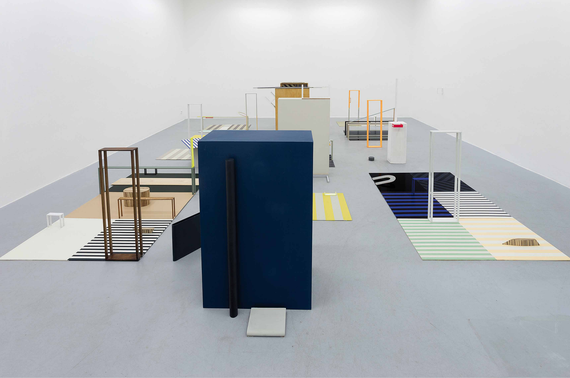
Nahum Tevet: For one Room / Pre jednu miestnosť, 2018, site-specific inštalácia, rôzne materiály, detail.