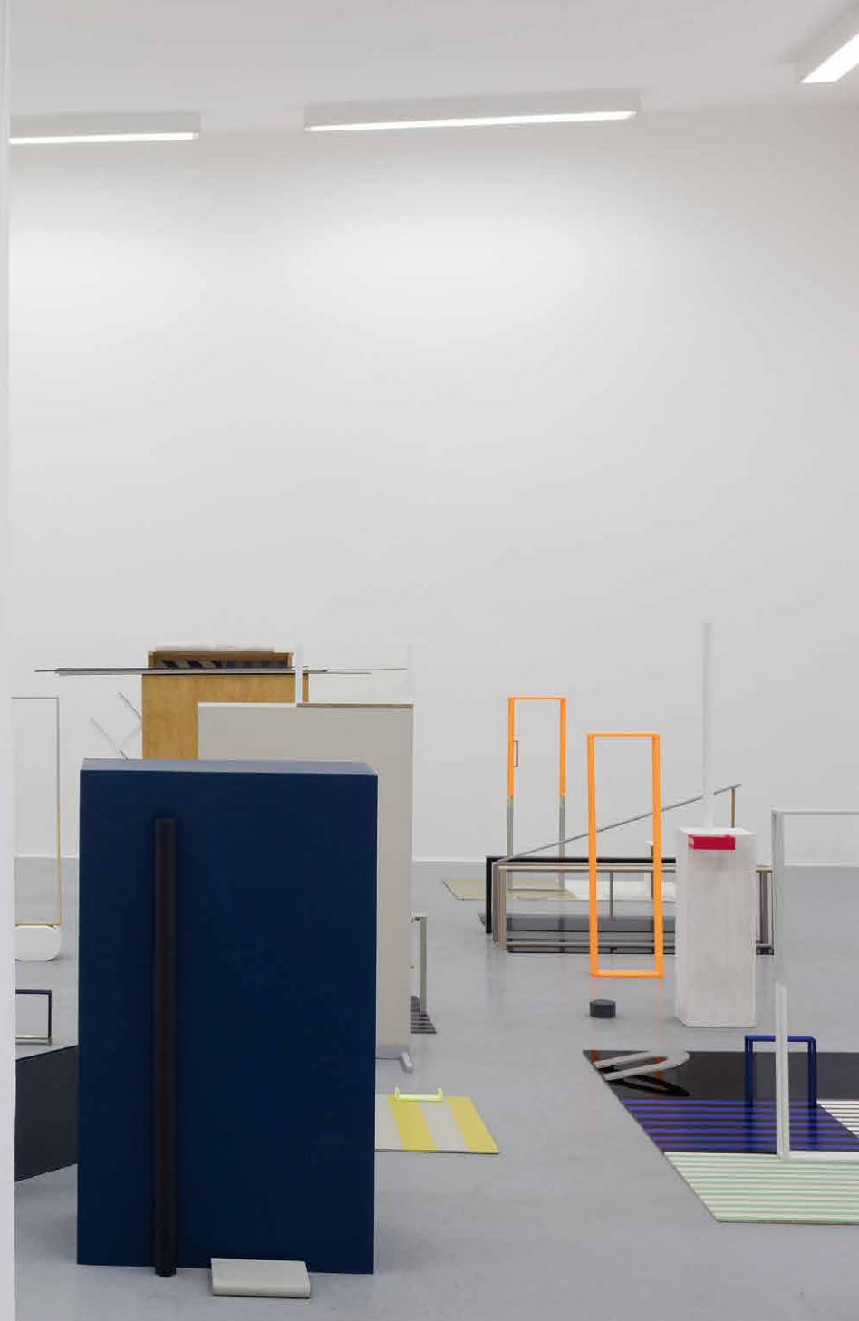
Pohľad do výstavných priestorov Domu umenia v Českých Budějoviciach. Vpravo: For one Room / Pre jednu miestnosť, 2018, site-specific inštalácia, detail. Vľavo: From Studio Studies: 22 Arrangements of ten Elements – In the Studio / Z ateliérových štúdií: 22 usporiadaní desiatich elementov – v ateliéri, 1978.