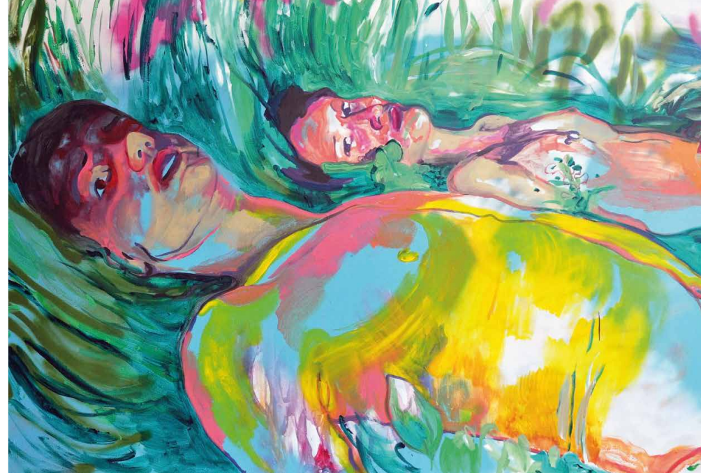
Kristína Bukovčáková: Tragédia, 2015, akryl a sprej na plátne, 120 x 180 cm

rozšírená, stále znova ma však prekvapuje, ak prerastá aj do roviny súčasného umenia, ktorá by sa mala vyznačovať kritickosťou. Presvedčenie o univerzál- nom umení a tvorbe, ktoré nie sú ovplyvňované žiadnymi externými faktormi a sú hodnotené len na základe kvality, bývalo populárnym naratívom, bohužiaľ však celkom iluzórnym a mnohokrát spochybneným. V tvorbe a aj v hodnotení umenia zohráva rolu nespočetné množstvo faktorov, medzi ktoré patrí aj rod a pohlavie. Príslušnosť k ženskému alebo mužskému pohlaviu nemusí nevyh- nutne ovplyvňovať námety diel, ale nepochybne určuje, aké sú na umelca či umelkyňu kladené očakávania a aké sú možnosti ich prezentácie a uplat- nenia. 4 Ak chceme vecnú debatu na túto tému, bolo by zaujímavé pripraviť štatistiku o sólových výstavách žien a mužov vo väčších slovenských galériách, o ich zastúpení v zbierkach alebo o počte profesorov a profesoriek na vysokých umeleckých školách. Aj bez štatistiky je však zrejmé, že skóre nie je ani zďaleka vyrovnané. K výstave Malba dnešných žien je nutné konštatovať, že projekty, ktoré sú rodovo slepé, pomáhajú udržať status quo a rezignujú na snahu meniť nerovnoprávne štruktúry rodových vzťahov.