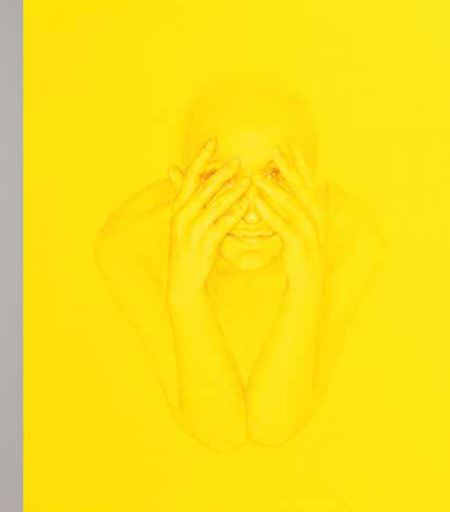
Dorota Sadvská: Svätá Lucia, 2017, akryl na plátne, 35 x 30 cm