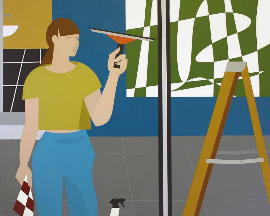
Alexandra Barth: Výklad, 2016, akryl na plátne, 165 x 180 cm