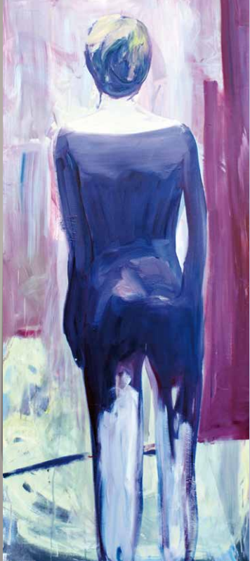
Jana Farmanová: Pompejanka I, 2013, olej na plátne, 175 x 75 cm