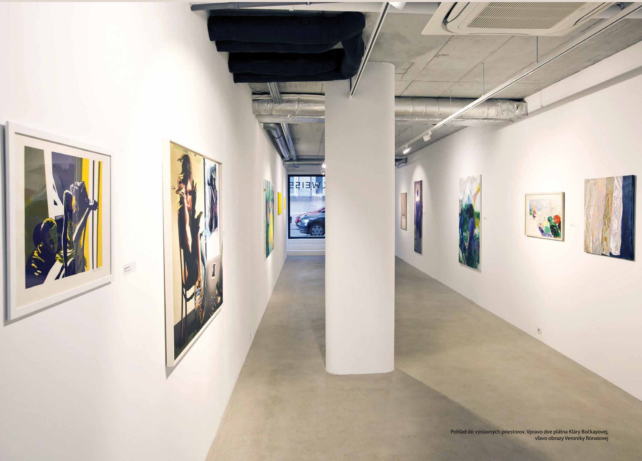
Pohľad do výstavných priestorov. Vpravo dve plátna Kláry Bočkayovej, vľavo obrazy Veroniky Rónaiovej