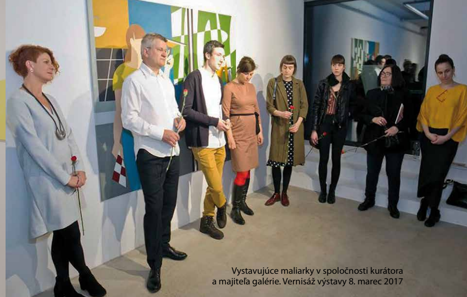
Vystavujúce maliarky v spoločnosti kurátora a majiteľa galérie. Vernisáž výstavy 8. marec 2017

Pri čítaní kurátorského textu k výstave sa nedokážem zbaviť pocitu bezradnosti. Je naozaj v roku 2017 možné poprieť rodový diskurz bez uvedenia argumentov a zrejme aj bez jeho znalosti? Je legitímne, aby bola výstava postavená na banálnom konštatovaní, že žena je človek a že ženské autorky spracúvajú ľudské námety? Na druhej strane, ako je možné argumentovať na odbornej úrovni bez toho, aby sa človek vyhol vysvetľovaniu absolútnych základov histórie žien, rodových východísk a aby okamžite nepadol argument o označovaní niekoho za „necitlivého, ignorantského muža“ (citát z kurátorského textu)? 2 Mojm rozhodnutím je reagovať vecnou analýzou, ktorá má skôr bližšie ku glose ako k odbornému textu, kde sa pokúsím objasniť, v čom je zvolený kurátorský prístup z môjho pohľadu problematický, až mylný.