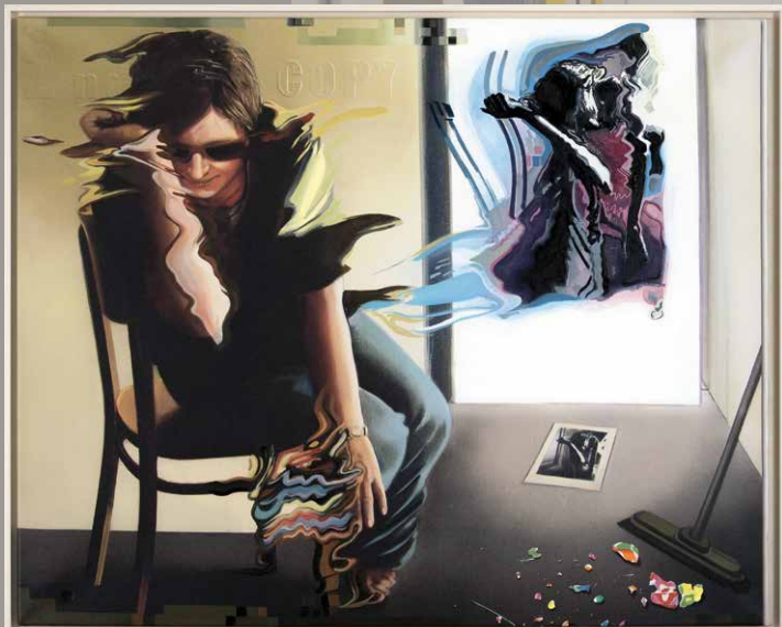
Klára BočKayová: More chce byť ako nebo, 1974, textil na sololite, akryl, fragment skla, 75,8 x 50 cm