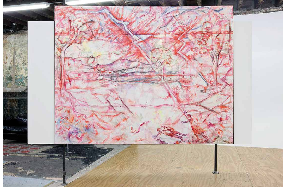
Jutta Koetherová: Hot Rod (after Poussin), 2009.

1994, 1998 a 2002. Projekt, ktorý môžeme čítať ako sarkastické obrazové dejiny novodobej slovenskej politiky, je úvodným príspevkom novej stálej rubriky FEM POZITÍV, v ktorej budeme predstavovať feministickú tvorbu domácich autoriek a autorov.