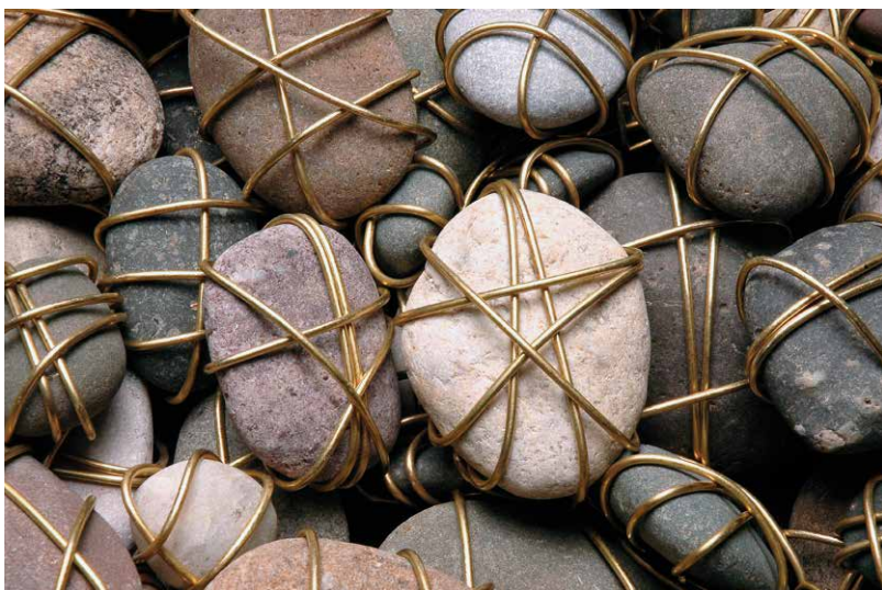
Peter Kalmus: Pamätník holokaustu, 1988 – 2008, 70 000 kamienkov omotaných mosadzným drôtom (približný počet obetí zo Slovenska), detail