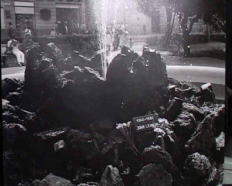
Mramorová doska s menom a dátami narodenia a smrti Johna Lenona, osadená do nefunkčnej fontány na Leninovej ulici (dnes Hlavná ulica), Košice, 1981