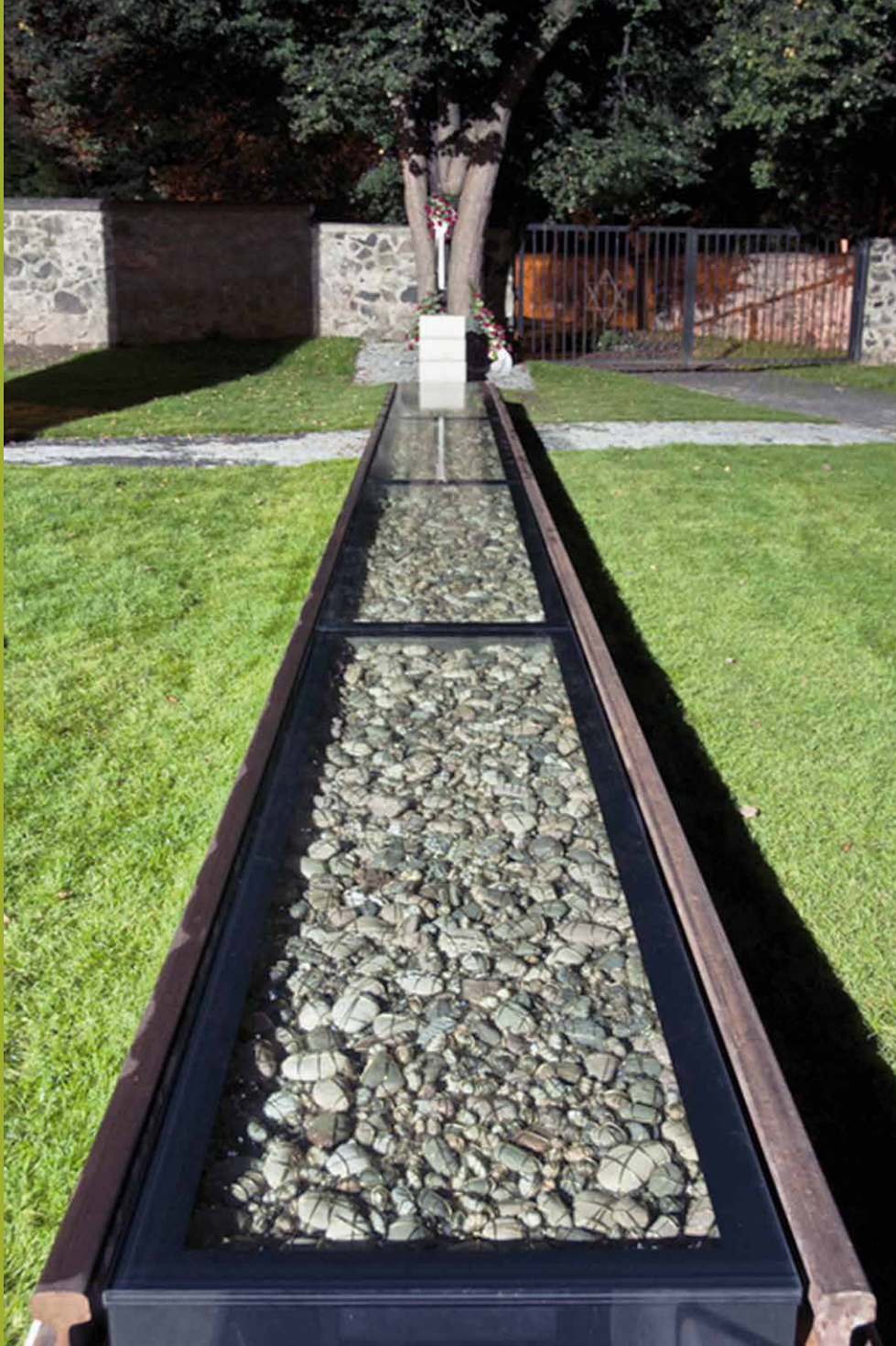
Peter Kalmus: Pamätník holokaustu, 1988 – 2008, 70 000 kamienkov omotaných mosadzným drôtom (približný počet obetí zo Slovenska), Park ušľachtilých duší, ul. T. G. Masaryka, pri areáli Technickej univerzity vo Zvolene