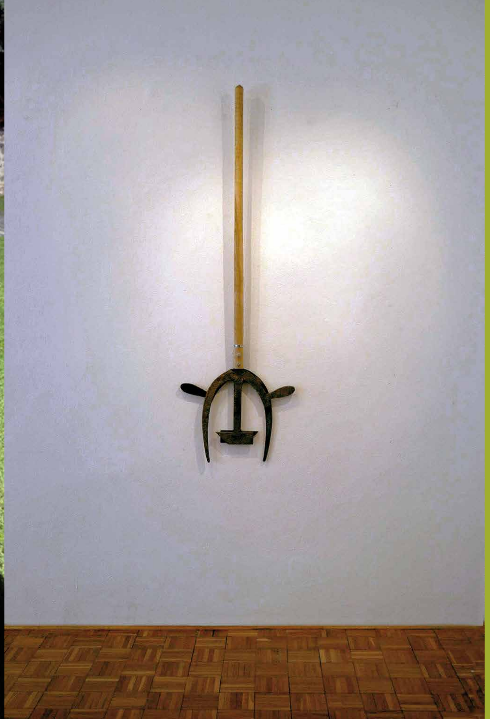
Peter Kalmus: Diablove vidly, 1988 – 2012, objekt, ready-made