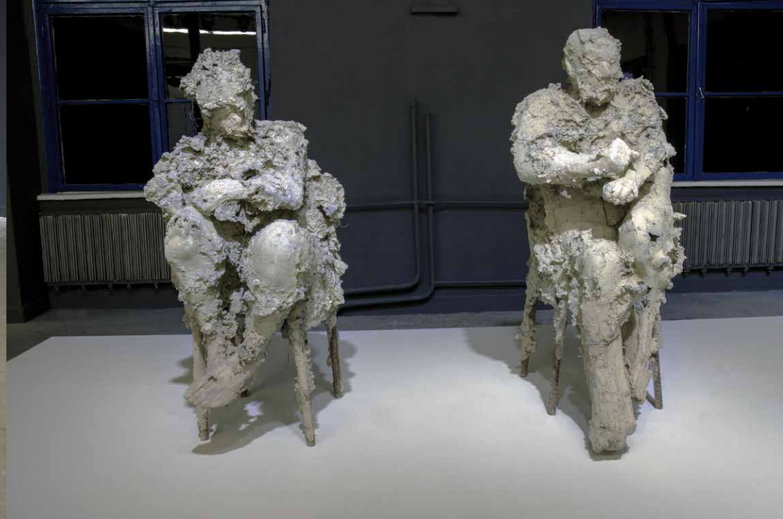
Ján Zelinka: Dokument, 2015, betón