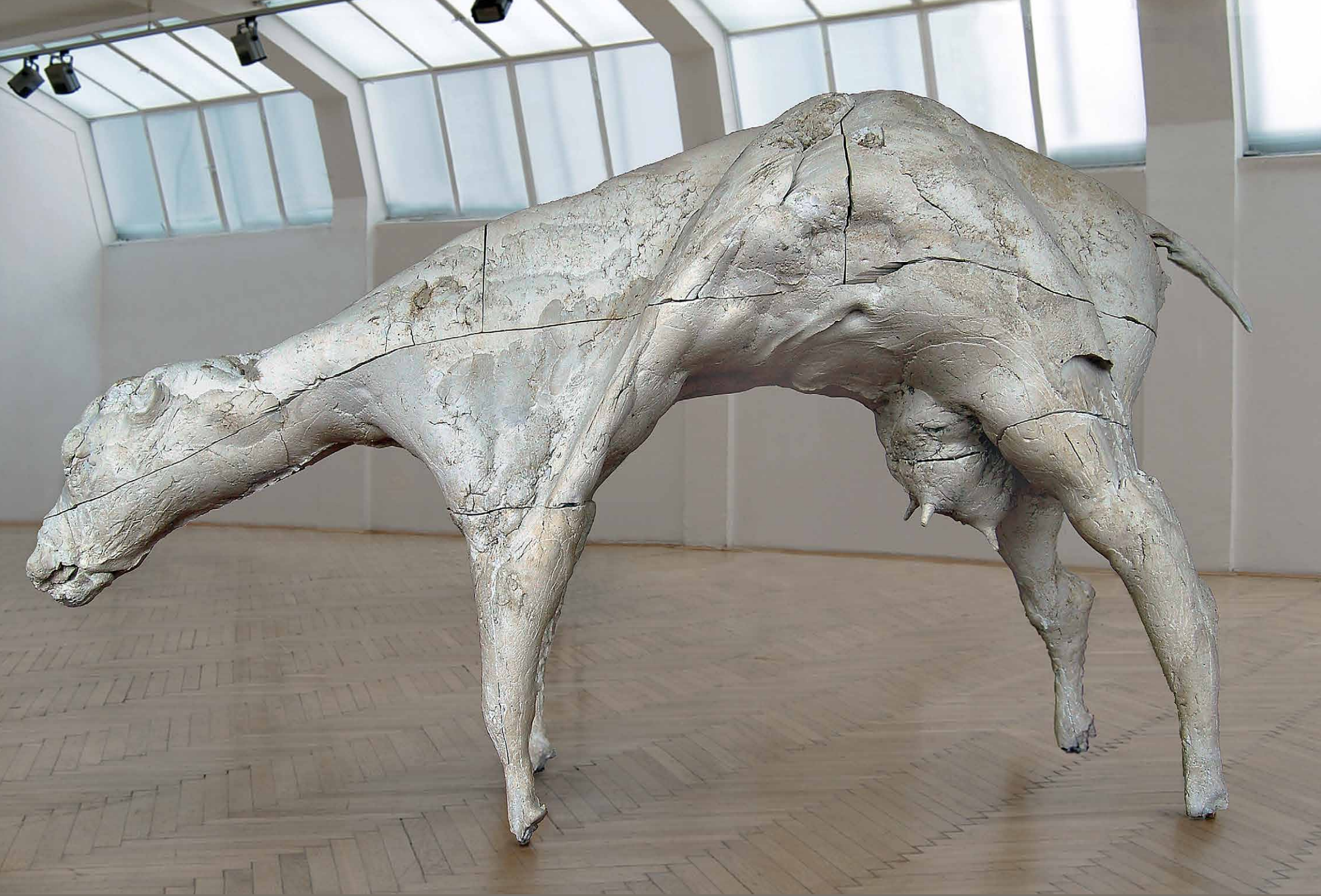
Ján Zelinka: Hľadám podstatu (krava), 2014, sadra liata do kravskej kože