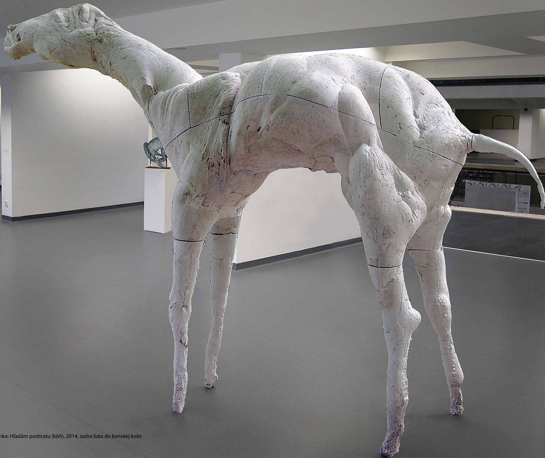
Ján Zelinka: Hľadám podstatu (kôň), 2014, sadra liata do konskej kože