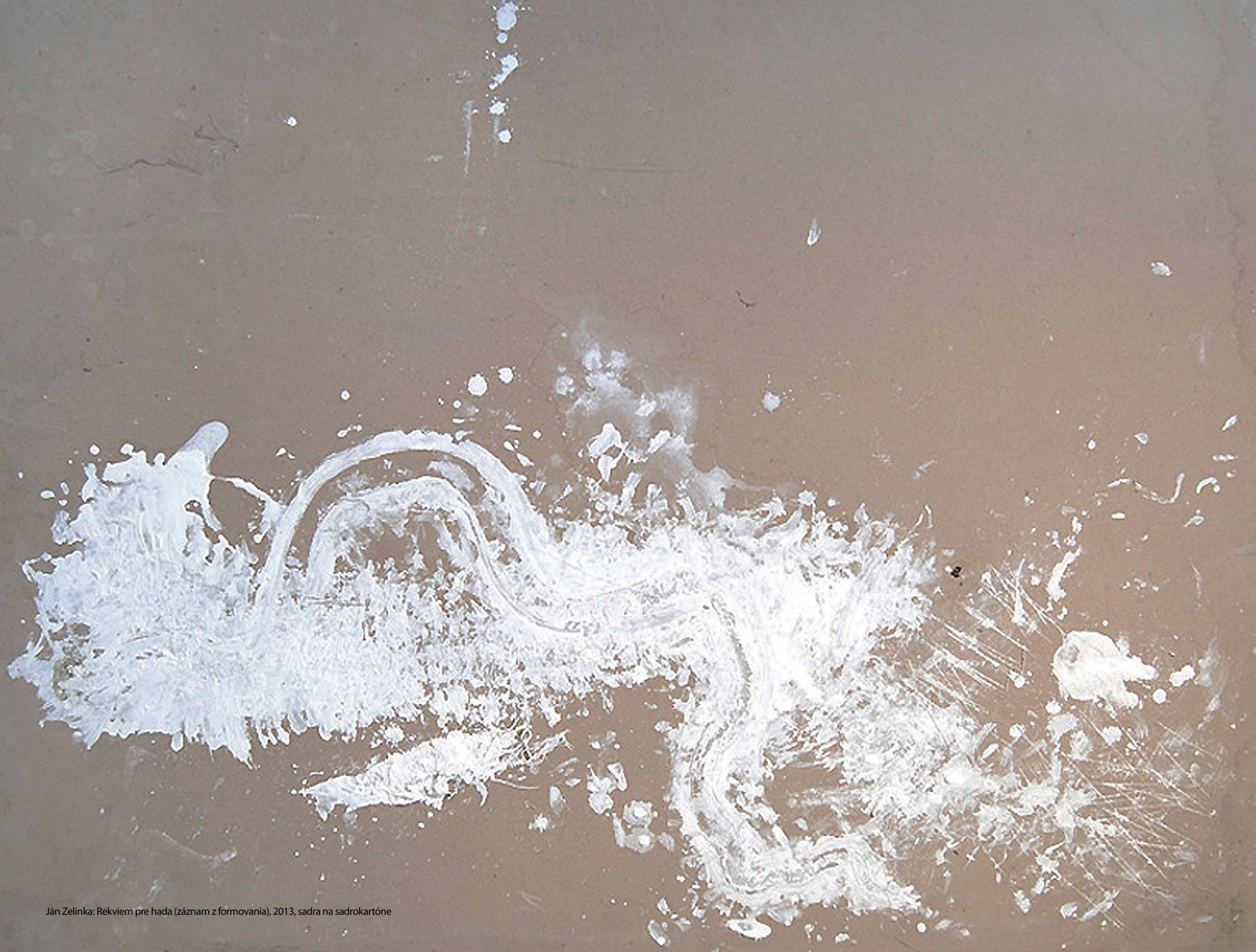
Ján Zelinka: Rekviem pre hada (záznam z formovania), 2013, sadra na sadrokartóne