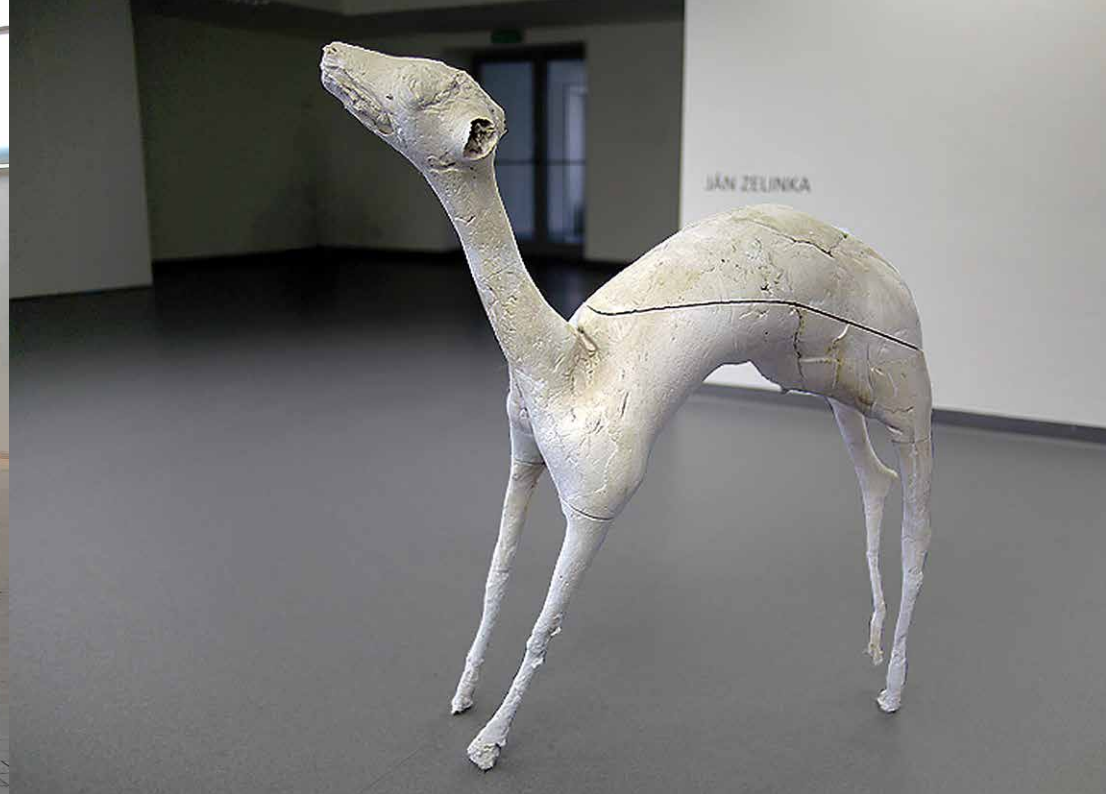
Ján Zelinka: Obrazoborectvo/oddelené súvislosti, 2010, betón